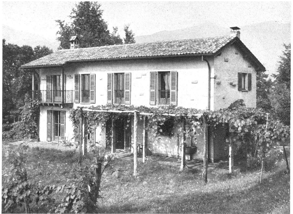
Gesamtansicht / Vue d'ensemble / General view

Einfache, aus dem traditionellen Tessinerhaus entwickelte räumlich gute Lösung / Petite maison de campagne en style régional; claire disposition des locaux / Small country house in somewhat traditional style with good plan