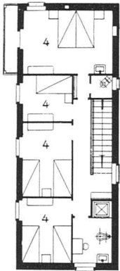
Obergeschoß 1:300 / Etage / First floor