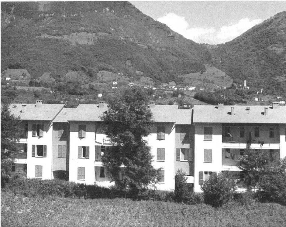
Westansicht / Façade ouest / West elevation