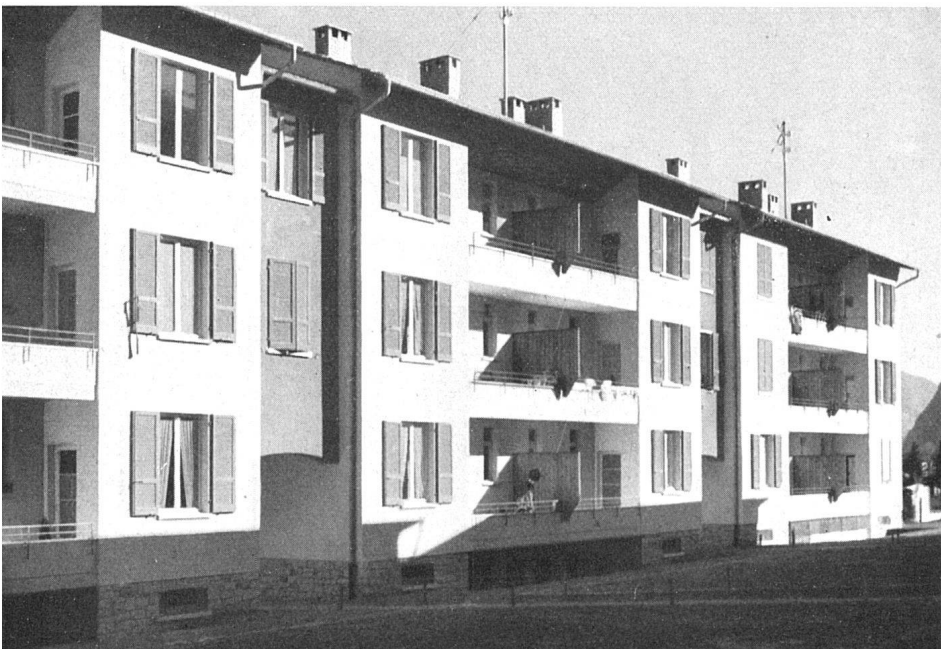
Ausschnitt Westfassade / Partie de la façade ouest / Part of west elevation