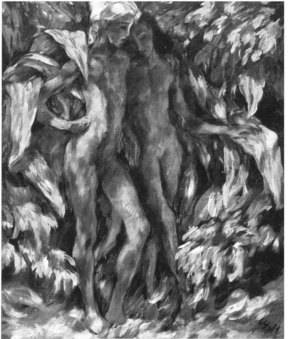
Karl Hofer, Unter Blättern , 1911. Sammlung der Erben von Dr. Theodor Reinhart, Winterthur / Sous la feuillée | Beneath the Leaves

gleichsam nach vorne verlegte Perspektive kann den näher ausgeführten Hintergrund entbehren, und besonders das landschaftliche Detail, das in der früheren Malerei von Hofer wenigstens als Stimmungskulisse seine Bedeutung gehabt hatte, tritt für einige Zeit ganz zurück.