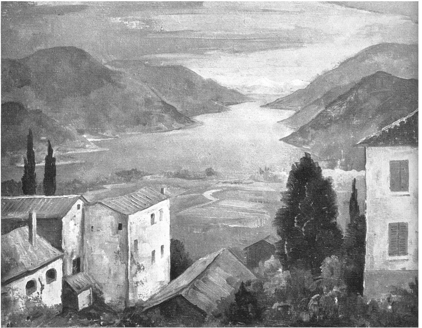
Karl Hofer, Landschaft im Tessin, um 1930 | Paysage tessinois | Tessin Landscape