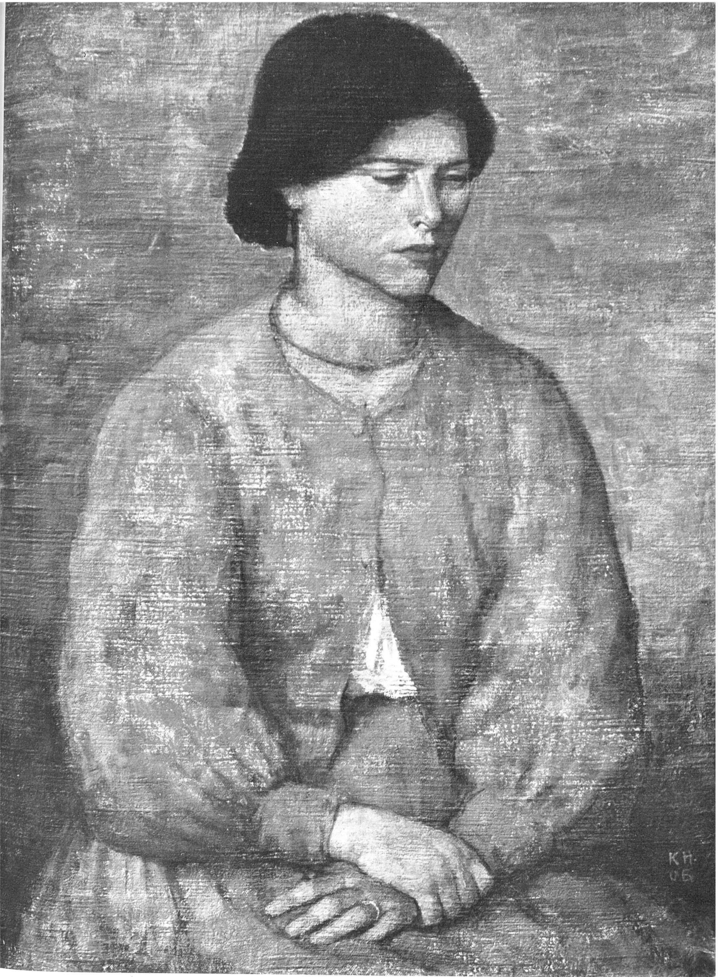
Carl Hofer, Italienisches Mädchen , 1906. Sammlung Georg Reinhart, Winterthur. Photo: Hans Linck, Winterthur | Jeune fille italienne | Italian Girl