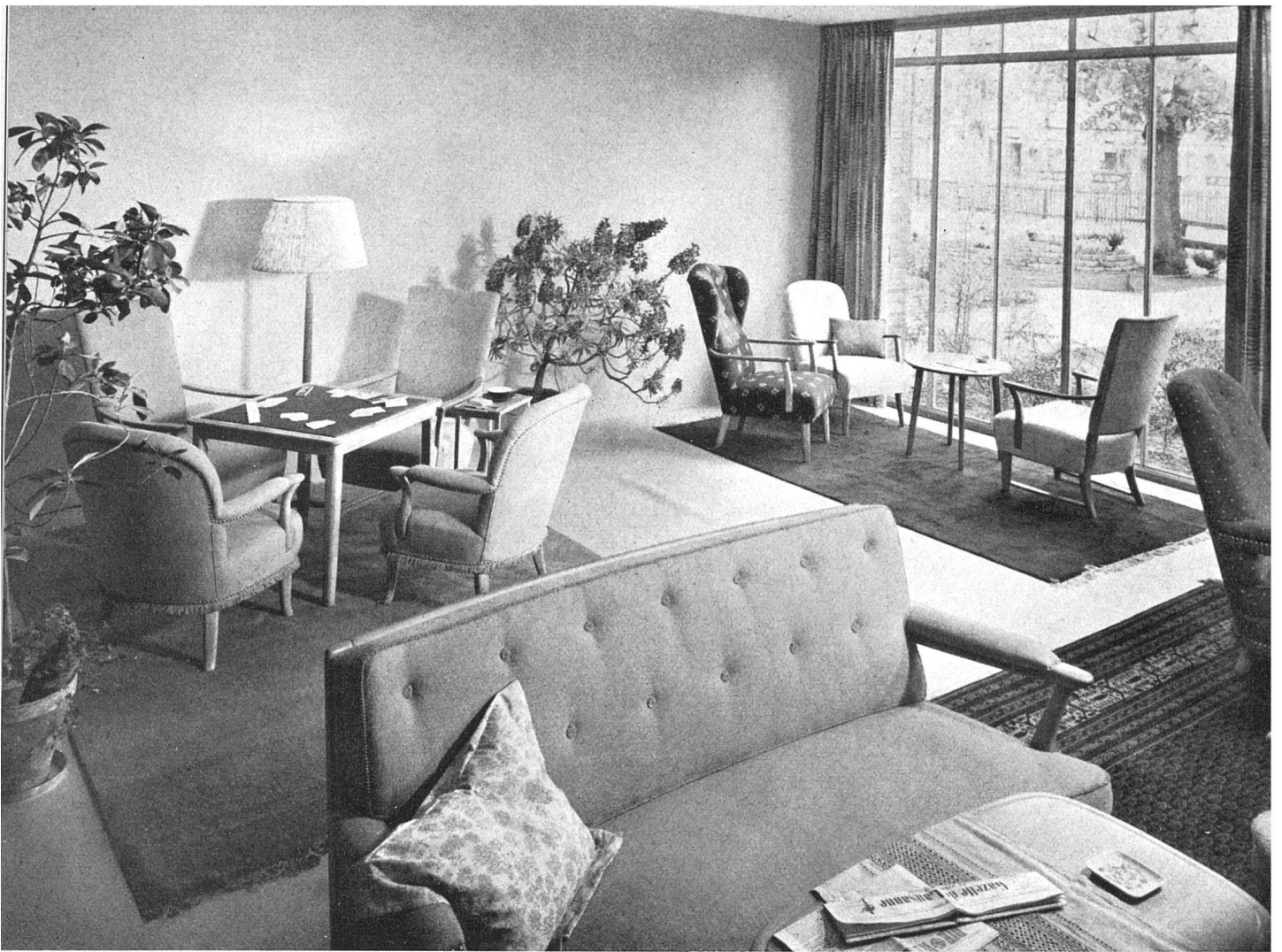
Hotelhalle, links Bridgetisch, leichtere Möbel beim Fenster, im Vordergrund Kaminsitzgruppe. Textilien: Möbelbezüge handgewoben, blaßgrün, c braun, weiß; Vorhänge: Druckstoff N. Soland SWB. | Hall d'un hôtel; à gauche table de bridge; groupe de meubles légers près de la fenêtre; au p plan, sièges devant la cheminée. Etoffes tissées à la main, vert pâle, brun foncé et blanc. Rideaux imprimés | Hotel lobby; at left bridge table, light fu near the window, in the foreground furniture group near the fireplace. Textiles: handwoven upholstery, pale green, dark brown and white; printed c

realisiert, die zu gewissen Zeiten vernachlässigt waren. Wir helfen heute, durch alle unsere Bestrebungen in der Richtung der Typenmöbel, dem Gedanken der dienstbaren, beweglichen und wachsenden Wohnung, und so helfen wir im gut verstandenen sozialen Sinn – gleichzeitig erhalten wir das Handwerk am Leben.