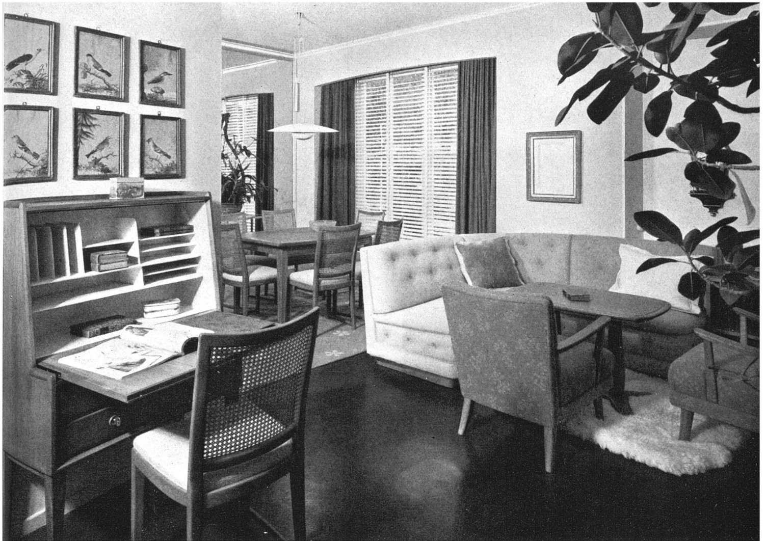
Wohn-Eßraum, zur Sitzgruppe mit ovalem Teppich gehörend. Möbel Nußbaumholz hell. Textilien: Möbelbezüge Handwebstoffe, uni Vorhänge, Knüppteppich von N. Soland SWB / Living room et salle à manger (l'ensemble de la page 397 en fait partie). Meubles en noyer clair et tissus exécutés à la main, rideaux unis, tapis de N. Soland / Living and dining room (the furniture group on page 397 belongs to this room). Furniture of light walnut and handwoven fabric, carpet by N. Soland

textilen Dekorationsstil eigener Prägung, gekennzeichnet durch die enge Zusammengehörigkeit von Möbel und Raum, geschaffen. Wie Spieler in einem Team sollen alle Möbel und sonstigen Dinge zusammenwirken und sich dienend zu einem Ganzen ordnen. Diese Bestrebungen führten in der Zeit der Pariser Weltausstellung 1937 zu den ersten Erfolgen, und bereits 1939, anlässlich der Landesausstellung, konnte eine gut abgestimmte Kollektion von Soland-Stoffen gezeigt werden.