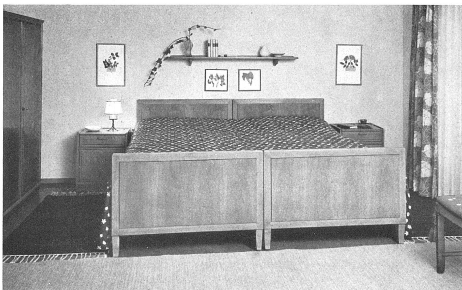
Schlafzimmer in hellem Nußbaumholz. Druckstoffe von N. Soland SWB (Vorhang, Bettüberwurf) / Chambre à coucher en noyer clair. Tissus imprimés (rideaux, couvre-lit) / Bed-room furniture of light walnut. Printed fabrics (curtains, bed-cover)