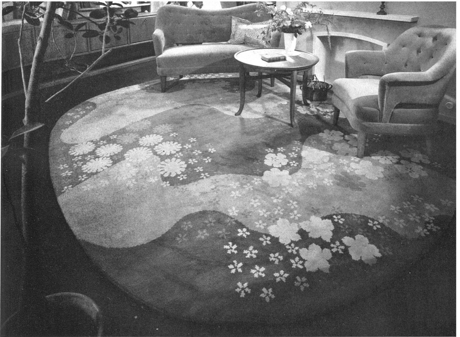
Ovaler Knüppteppich von N. Soland SWB in einem Wohnraum. Farben: dunkles und helles Olivgrün, Motive Ocker und Elfenbein / Tapis ovale dans un salon. Tons: olive clair et foncé, motifs ocre et ivoire / Oval carpet in a living-room; colours: light and dark olive-green, pattern ochre and ivory