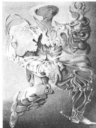
Otto Tschumi, Barocker Krieger . 1947. Tempera und Pastell. Privatbesitz New-York

«Verschiedene Rassen, wilde und überzüchtete, westliche und östliche, mochten zusammengespielt haben, um die-