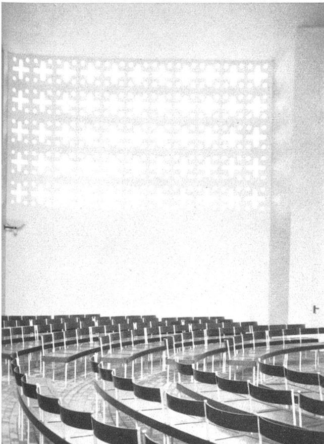
Innenansicht mit Aufbahrungsnische | Intérieur | Interior