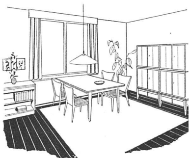
Eßraum mit Typenmöbeln von W. Wirz SWB, Innenarchitekt, Sissach