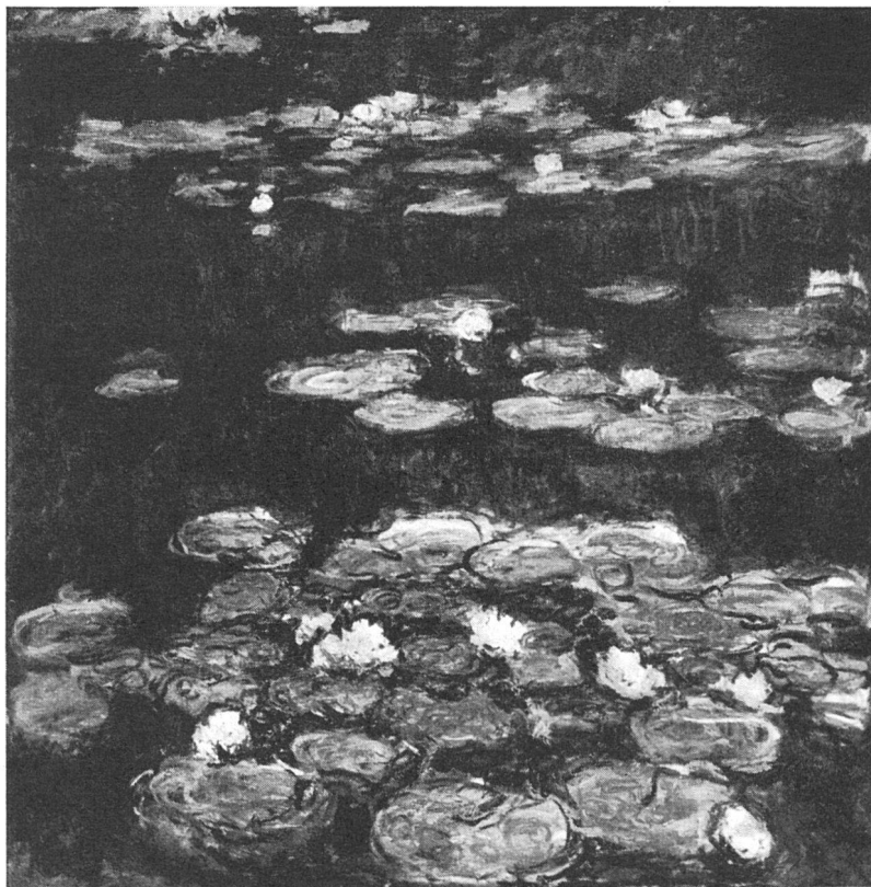
Claude Monet, Les Nymphéas , um 1910. Aus der Impressionisten-Ausstellung in der Kunsthalle Basel

nes Bostoner Museum sei als Besonderheit das Ankaufssystem für zeitgenössische Kunst erwähnt. Abgesehen davon, daß auch für die moderne Abteilung jeder Ankauf von den trustees bewilligt werden muß, kauft das Museum von lebenden Künstlern nur unter der Bedingung, daß das Museum die bereits gekauften Bilder eventuell später gegen bessere oder interessantere umtauschen kann. So kann das Museum unbefangener schon beim jungen Künstler kaufen, weil es die Rückversicherung hat, auf jeden Fall zu seinen stärksten oder reifsten Werken zu kommen. Die Hilfe für den jungen Künstler kann also – ähnlich wie beim Basler Kunstkredit – schon sehr früh einsetzen. Das Bostoner Museum besitzt außerdem die (nach dem Museum von Chicago) zweitgrößte Kunstschule Amerikas, an der – vom Museum aus –, ähnlich wie an unseren Gewerbeschulen, Kunstunterricht erteilt wird. So umfaßt das Museum in Amerika wirklich das gesamte künstlerische Leben – von der Pflege der Kunst der Vergangenheit bis zur Erziehung zum Kunstverständnis und zum Ausüben der Kunst der Gegenwart. m. n.