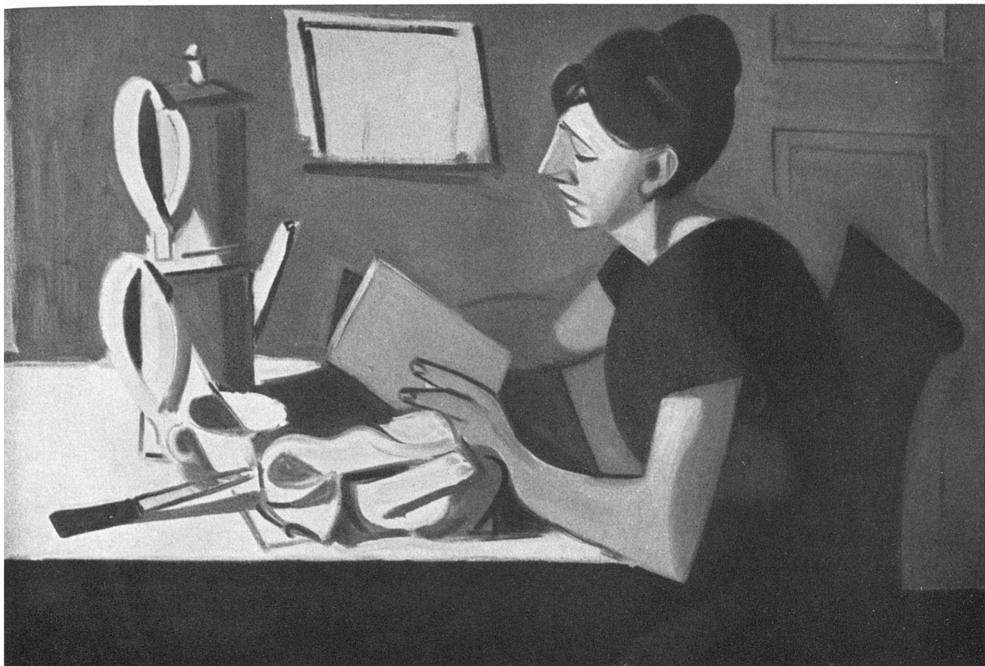
Georges Froidevaux, Femme au livre jaune / Frau mit gelbem Buch / The Woman with the Yellow Book

seule, de placer les plans: pour lui, au bout d'une toile, il n'y a qu'une solution, qu'il faut chercher sans relâche et il ne sera apaisé qu'une fois qu'il l'aura découverte. Mais qu'on ne se trompe pas sur le sens de cette géométrie: c'est alors qu'intervient la fantaisie. A l'aube de cet univers qui se refuse obstinément à la facilité, il y a, qu'on le veuille ou non, le choix, choix des couleurs, qui se déterminent l'une l'autre en une mathématique mystérieuse, choix de la composition, qui permettra la suggestion des formes et des volumes. Et tout au long du travail, la simplification, la réduction à l'essentiel, pour atteindre au maximum d'intensité, à l'équilibre parfait. Ce qui fait qu'aucune toile de Froidevaux, même les plus hautes de tons, ne paraissent criardes. Toutes au contraire semblent tenues, dominées, claires au fond. Et d'un charme étonnant, car il y a chez cet artiste, en même temps qu'une science profonde de coloriste, une fraîcheur de vision et un talent inné qui lui font poser audacieusement les teintes les plus catégoriques, les plus incompatibles, avec une sûreté presque infallible, qui aboutit à une création, dans plusieurs de ses dernières toiles, à la fois originale et merveilleusement humaine. La tâche des peintres d'aujourd'hui apparaît bien de retrouver l'humain, le doux humain, à travers les raisons et les déraison exigeantes de leur art.