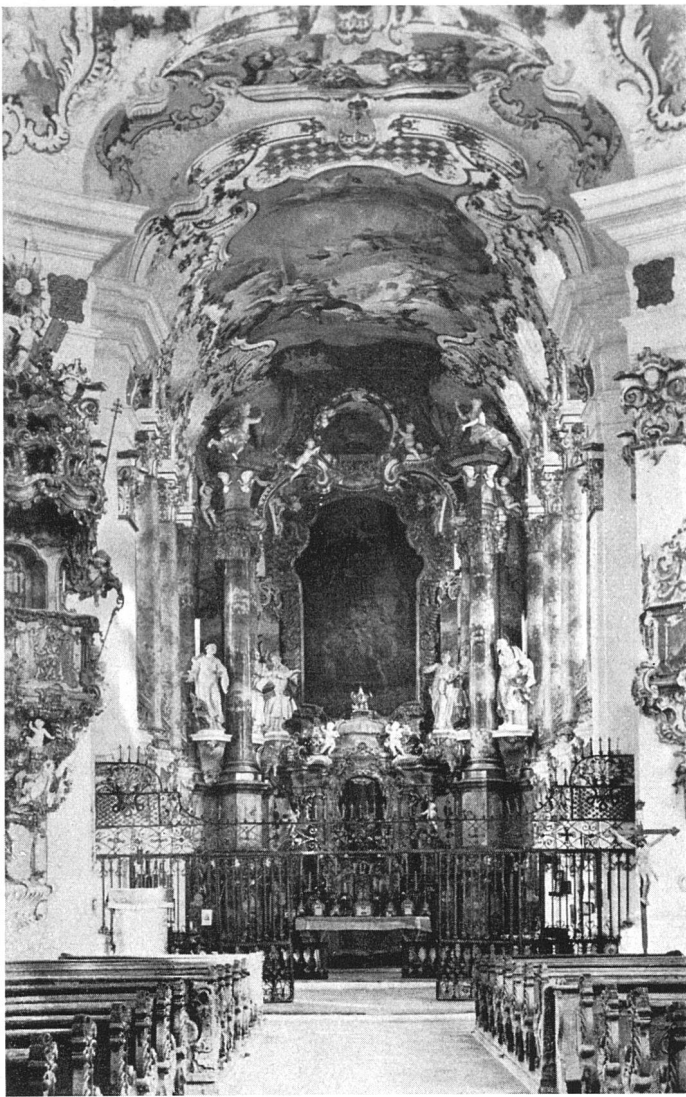
Spätbarocke Stukkatur und Malerei im Zusammenwirken mit der Architektur. Wies, Chor der Wallfahrtskirche von Dominikus Zimmermann, 1746–1754 | Stucs et peinture en combinaison avec l'architecture baroque. Wies, chœur de la «Wallfahrtskirche» de Dominikus Zimmermann 1746–1754 | Baroque stucco and painting in harmony with the architecture. Wies, choir of the church, by Dominikus Zimmermann 1746–1754

nicht erhalten – zu freiem Sichregen in vorbestimmte Felder ein. Die Großbauten des römischen Weltreichs erzählen mit ihrer Steigerung der Maße und der Raumweite vom Stolz der Macht. Der Wunsch nach Prachtentfaltung löst die Geschlossenheit der Wand, ruft Säulen, verkröpfte Gebälke, statuengeschmückte Nischen zu imposantem dekorativem Wirken auf. Über die Wandmalerei unterrichtet uns Pompeji. Auch sie dekoriert, weitet die Räume mit Scheinarchitektur und Durchblick ins Freie, treibt mit naturnah gebildeten Phantasiegestalten ein buntes Spiel heiterer Daseinsfreude. Die altchristliche Kultur bietet in Basilika und Kuppelbau alles zur Verherrlichung des Jenseitigen auf. Während die Plastik um ihrer Körperlichkeit willen verbannt wird, überzieht das Mosaik alle Sichtflächen der Wände und Gewölbe mit schimmernden Erscheinungen symbolhaft-feierlicher Gestalten, deren architekturverwandte Strenge der Goldgrund dem