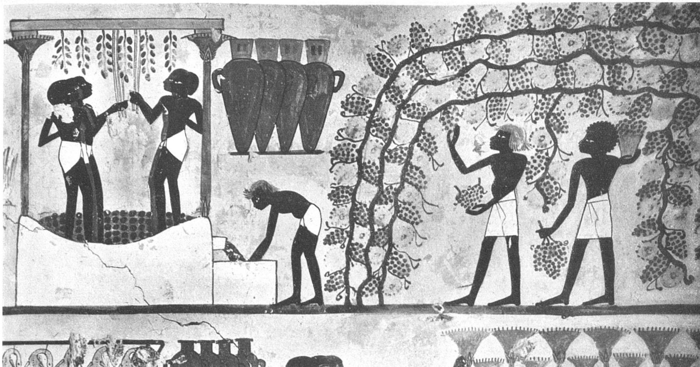
Ägyptische Wandmalerei der 18. Dynastie (um 1425 v. Chr.). Theben, Grab des Nakhet | Peinture murale égyptienne, 18 e dynastie (vers 1425 av. J.-C.). Thèbes, tombeau de Nakhet | Egyptian mural fresco of the 18th dynasty (about 1425 B. C.). Thebes, tomb of Nakhet