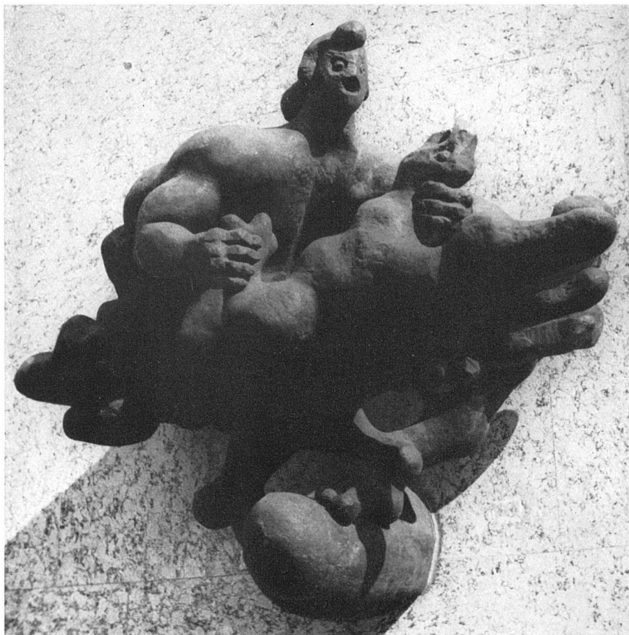
Bronzeplastik von Jacques Lipchitz an fensterloser Fassade des Ministeriums für Erziehung und Gesundheit, Rio de Janeiro | Bronze de Jacques Lipchitz au Ministère de l'éducation et de la santé, Rio de Janeiro | Bronze by Jacques Lipchitz at the Ministry of Education and of Health, Rio de Janeiro