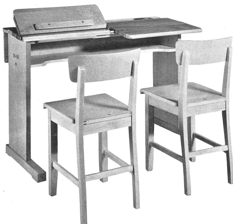
Doppeltisch mit verstellbarer Tischplatte mit klappen, Stühle mit Gummipuffern. Buchen- Eichenholz | Pupitre pour deux enfants; de réglable avec abatants; chaises à tampons de ca chouc, en hêtre ou chêne | Desk for two with ad justable table top and reading boards, of beech or oak