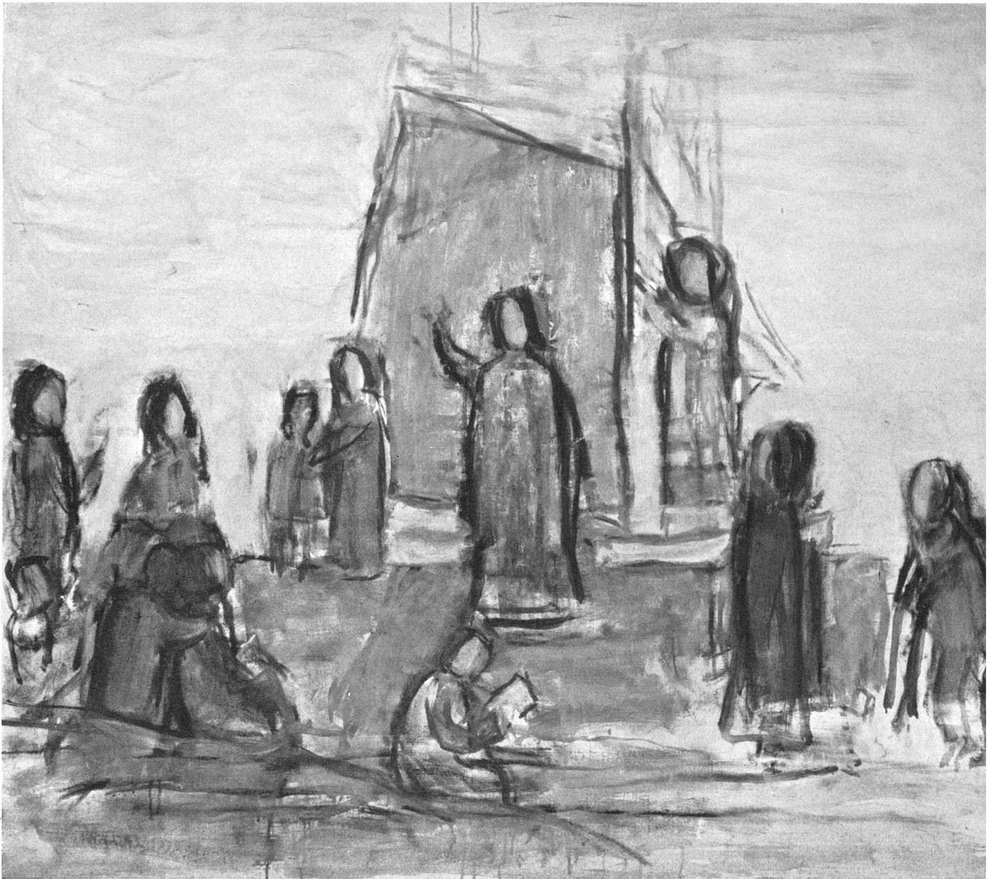
Carl Kylberg, Berufung Petri / Vocation de Saint Pierre / Peter's Call