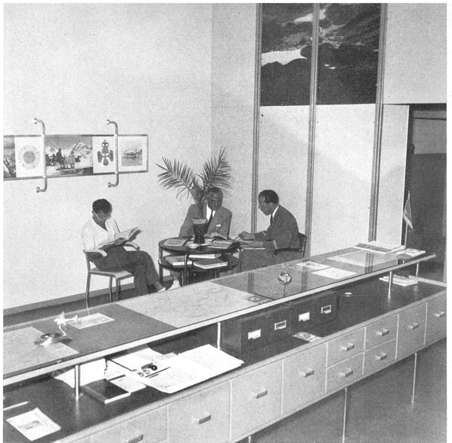
Empfangsecke | Coin de réception | Reception

Gestalter: Fritz Keller, Graphiker, Zürich