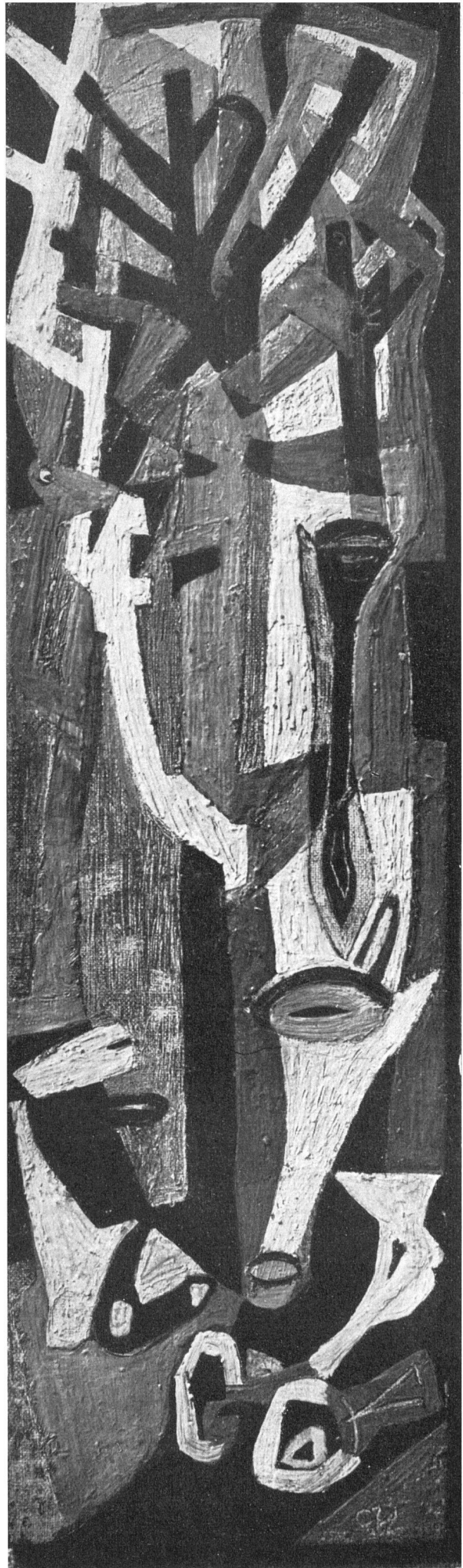
Georg Meistermann, Figures im heißen Tag , 1947. Galerie Dr. Rüsche, Köln | Figures dans le jour chaud | Figures in the Hot Day

In ihnen waltet keine unverbindliche Phantasie. Da ist kaum etwas, was nicht aus einer nachdenklichen «Umsetzung» der Natur entstanden ist – der sichtbaren, tastbaren, fühlbaren «Natur» im goethischen Sinne. «Baumspitzen» heißt ein Bild. «Fruchtlandschaft» ein anderes. «Muschelgarten», «Fisch und Vogel», «Wasserfall», «Fliegender Vogel vor Blau» sind die Themen. Da ist nur wenig, was nicht von Werden, Wachsen, Innehalten, Vergehen kündet. Manchmal ist auch eine Allegorie versucht worden. Da aber mischt sich störend eine Art literarisches Programm hinein, eine Nuance Otto Dix oder George Grosz. Das empfindet auch Meistermann. Er rückt von diesen, immer wieder