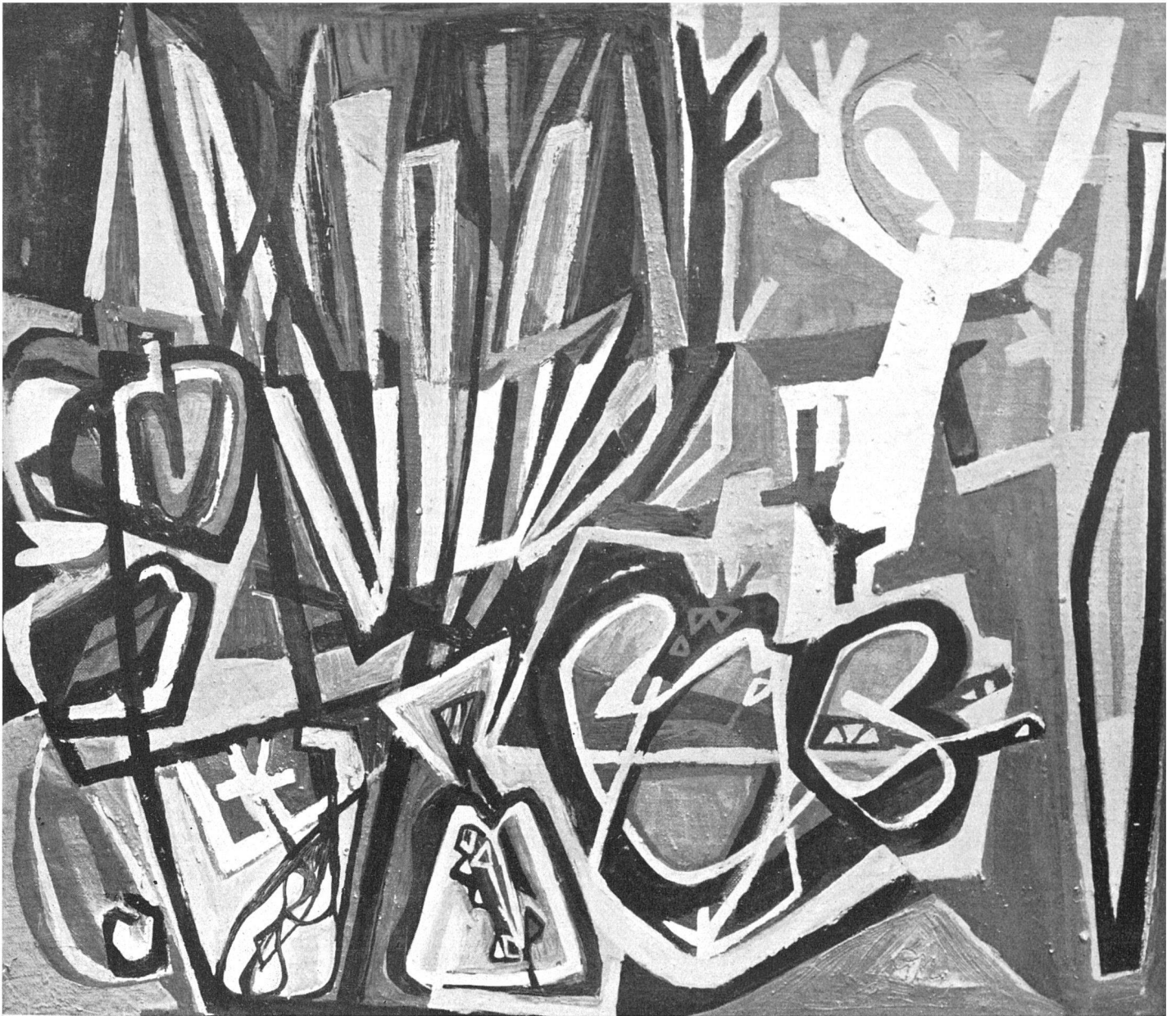
Georg Meistermann, Der weiße Baum , 1947 | L'arbre blanc | The White Tree