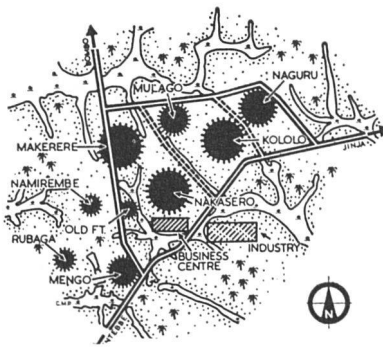
Schematischer Plan von Kampala (Ostafrika)

Die Grünstreifen enthalten auch Gebiete für Schrebergärten, die von großen Staudämmen her berieselbar sind. Die 4 Staudämme dienen einem doppelten Zweck: 1. Sammlung des über-