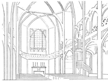
Die erste Betonkirche: St-Jean de Montmartre, Paris, 1894. Architekt A. de Baudot

Bei der aufmerksamen Lektüre der theoretischen Auseinandersetzung mit dem heutigen Problem des Kirchenbaus findet der Leser manche die Abklärung dieser wichtigen und recht komplizierten Fragen fördernde Gedanken. Die Einstellung des Verfassers geht am überzeugendsten aus dem Kapitel Die neuzeitlichen Kirchenbauten hervor: «Vor dem historischen Hintergrund, in welchem mit Jahrhunderten gerechnet wird, erscheint die kaum ein Menschenalter dauernde moderne Entwicklung als ein Beginn und nicht als selbständiges Ganzes. Gleichzeitig erwächst aus der historischen Betrachtung die Erkenntnis, daß auch in den großen Stilepochen nur relativ wenige Bauten die höchsten Stufen architektonischen Ausdruckes erreicht haben, während der größere Teil bescheideneren Ranges ist, aus welchem jedoch diejenigen Werke markant hervortreten, die als Pioniere fortschrittlicher Ideen, als unentbehrliche Vorgänger und Zwischenstadien die Verwirklichung der überragenden Meisterbauten erst ermöglicht haben. In gleichem Sinne werden auch unsere zeitgenössischen Bauten und ganz besonders solche, die den undankbaren Weg des Suchens gehen, Bausteine für spätere, höherstehende Werke sein, sofern sich unsere innere Einstellung zur Weiterentwicklung vorhandener guter Ansätze durchringt.»