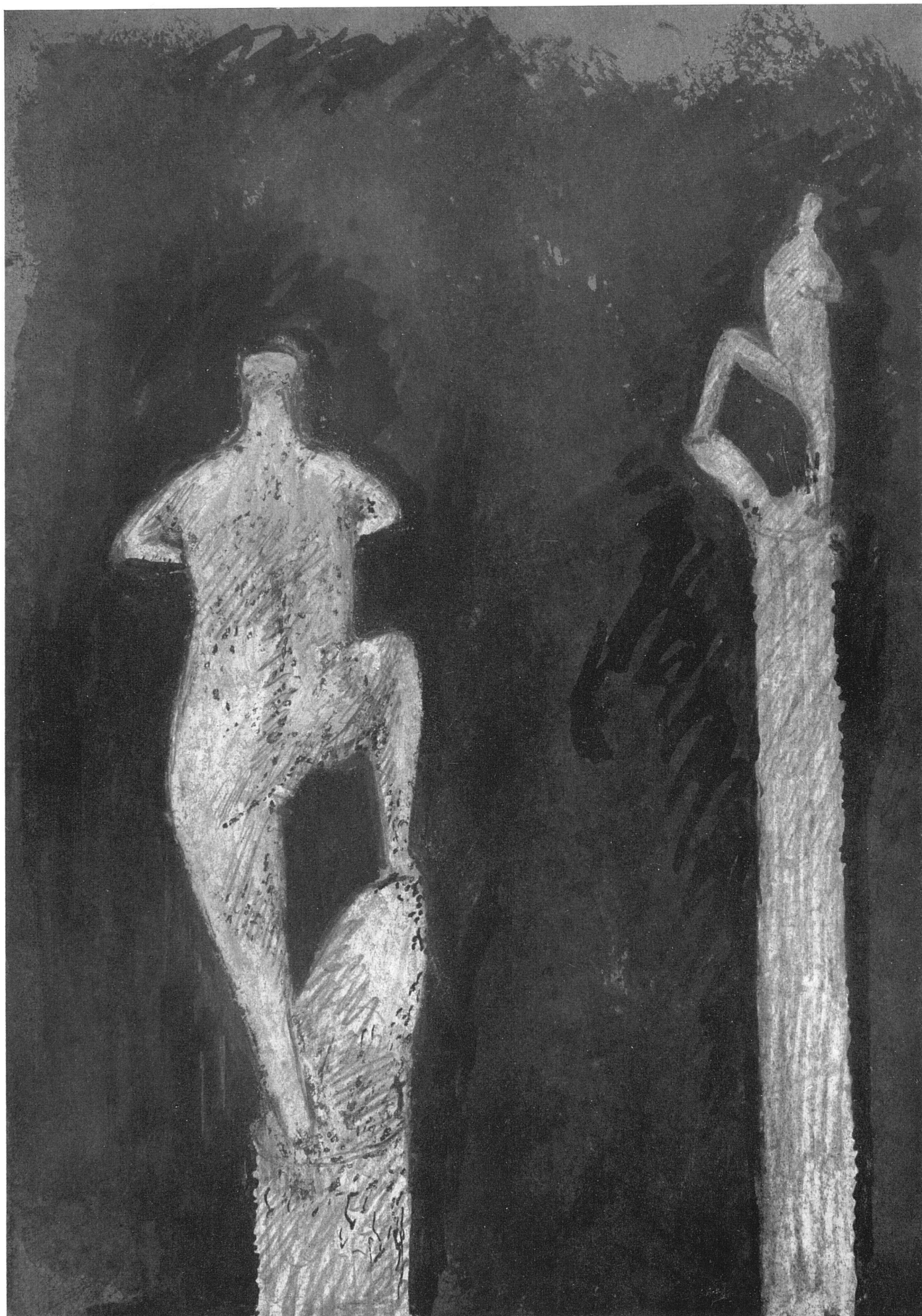
Benedict Remund, Stehender Akt. Entwurf für eine Plastik im Garten des Bürgerspitals Basel. Farbige Zeichnung | Nu. Dessin en couleurs | Nude standing. Coloured design