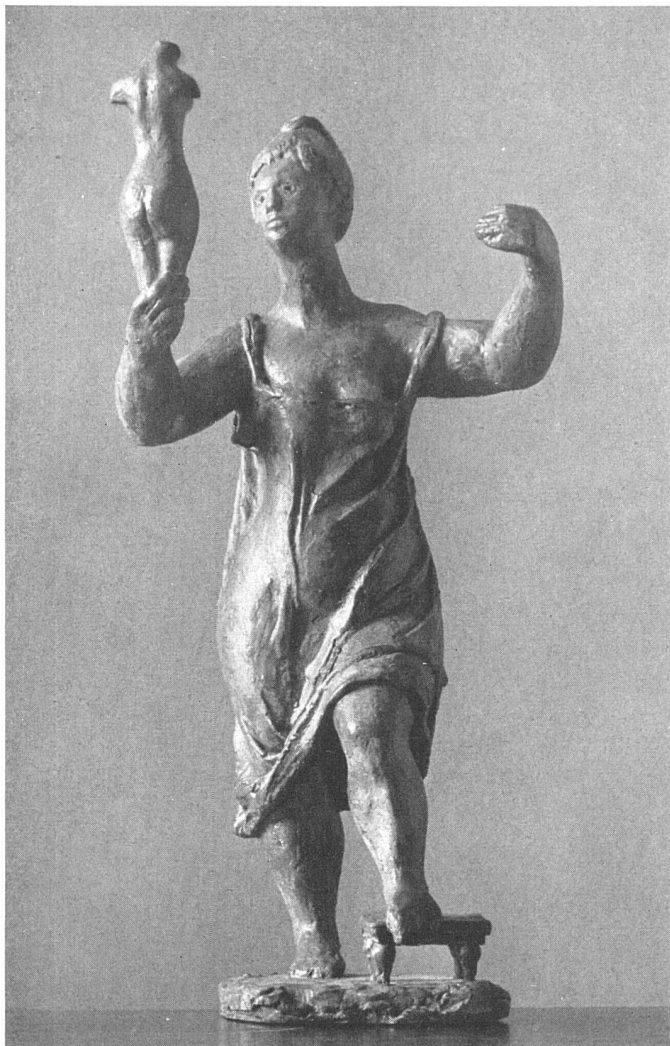
Albert Schilling, Bewunderung , Bronze, 1940/41 | L'admiration . Bronze | Admiration . Bronze

Großen Rates, der den Ausführungskredit zu bewilligen hatte. Vor den parlamentarischen Vertretern des Basler Volkes stand allerdings nur der Gipsentwurf; die Umsetzung in den roten Sandstein mußte man sich in Analogie zum «Roten Hahn» vorstellen. Remund hat diesem Relief den Titel «Der Wald» gegeben. «Fabelwesen» wäre noch besser und vor allem für die urteilenden, bzw. aburteilenden Parlamentarier vielleicht auch einleuchtender gewesen. Sie, die in diesem Augenblick nichts anderes als ein Teil des «großen Publikums» waren, hätten dann vielleicht darauf verzichtet, nach einer «Waldesstimmung» zu fahnden, und dafür leichter den Zugang zu dieser, dem romanischen Mittelalter so verwandten Fabelwelt gefunden.