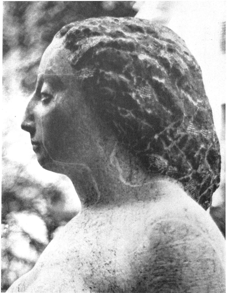
Albert Schilling, Stehende, Detail | Nu debout. Détail | Nude standing, detail

man sich dieses merkwürdige Verhältnis, die Bindung des Bildhauers an den «Gegenstand Mensch», vielleicht damit, daß der menschliche Körper die ihm nächstliegende Maßeinheit ist, durch die er am unmittelbarsten die Spannung zu dem zu schaffenden plastischen Körper erfährt, wobei der «Gegenstand Mensch» selbstverständlich nie als Modell im naturalistischen Sinne gemeint ist.