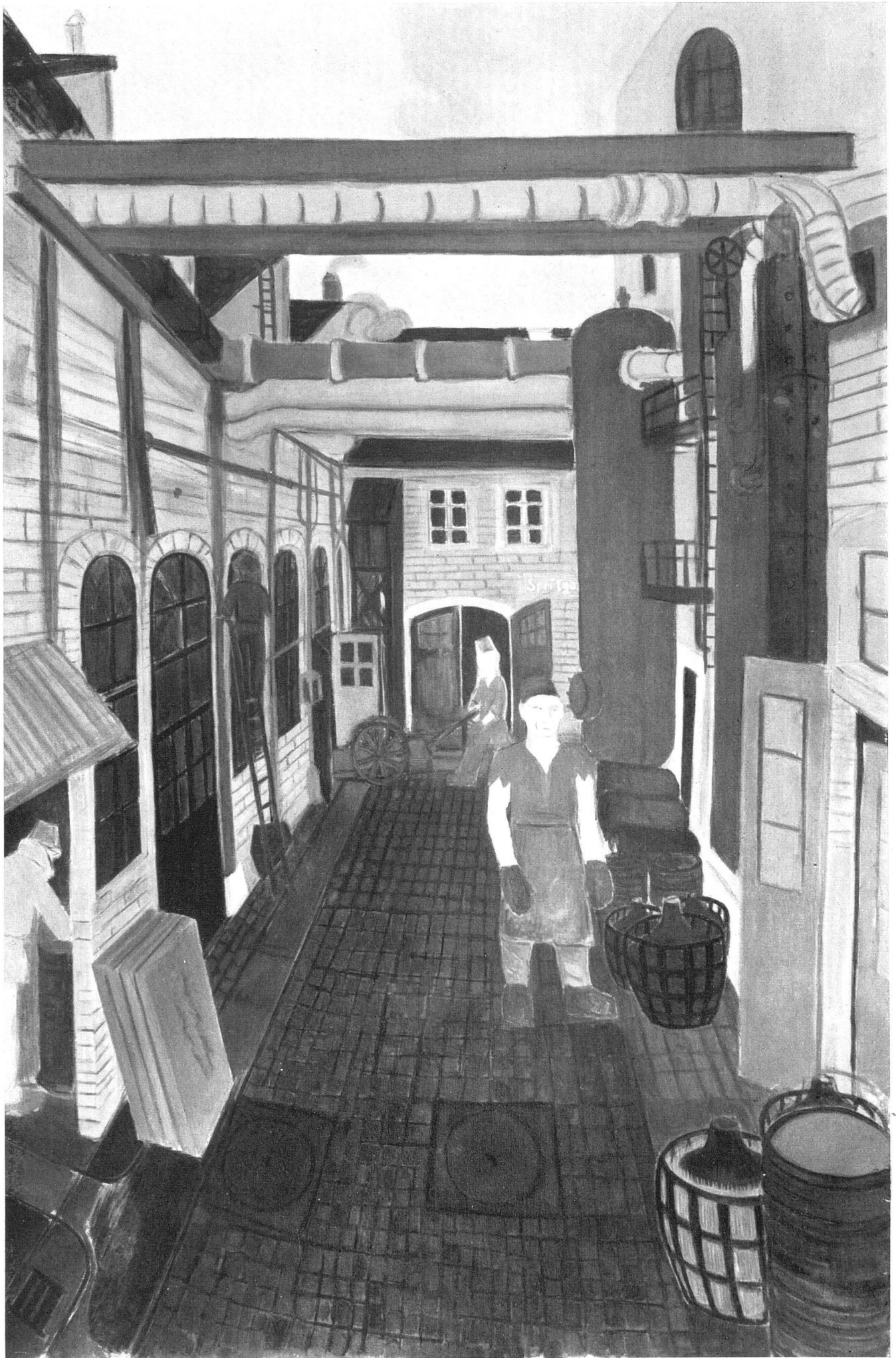
R. Mäglin, «Grüingasse» in einer chemischen Fabrik, 1949 | «Rue verte» dans une fabrique de produits chimiques | «Green Alley» in a chemical factory