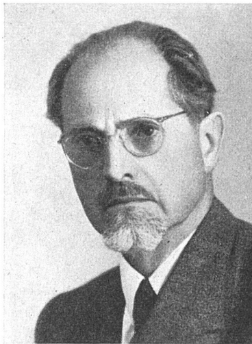
Architekt BSA Werner Pfister †

Aus der großen Zahl der Bauausführungen der Gebrüder Pfister seien folgende genannt: Siedlungen der Wohnbaugenossenschaften Bergheim (1908) und Kapf (1911); eine große Anzahl von Einfamilienhäusern (1908–1938); Schulhäuser Limmatstraße, Zürich 5 (1910), Altstetten und Meggen (1912); Geschäftshaus Peterhof (Grieder) in Zürich (1912); Bankgebäude AG. Leu & Co., Zürich (1914); Schweizerische Nationalbank in Zürich (1921); Bahnhof Zürich-Enge (1923); Kantonsschule Winterthur; Kraftwerk Wetzlingen; Kranken- und Diakonissen-