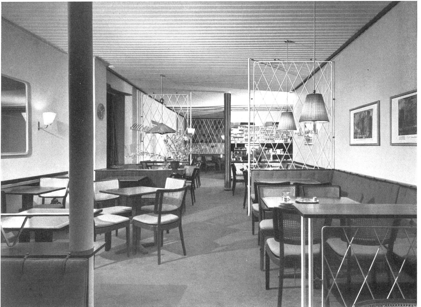
Blick vom Eingang gegen Buffet | Le buffet vu de l'entrée | View from entrance towards the bar