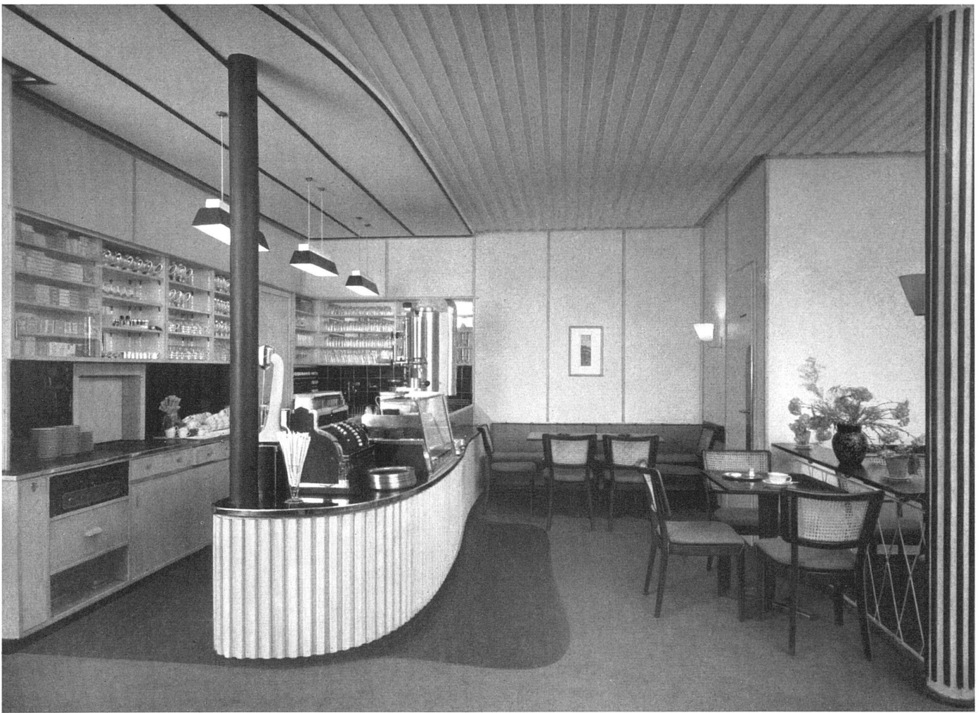
Buffetanlage. Wände Pavatex hell, Boden roter Spannteppich. Schreinerarbeiten in Esche natur | Le buffet. Parois claires en pavatex. Sur le sol, moquette rouge. Boiseries en frêne naturel | Bar. Walls light Pavatex, floor red all-over carpet. Woodwork in natural ash