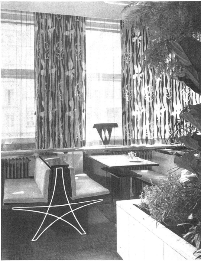
Sitzgruppen am Fenster, rechts Pflanzengarten | Intérieur; à droite, la jardinière | Window lounge, right flower garden.

Der durch den Treppenaufgang bedingte Einbau ist auf ganze Länge und Höhe mit einem Spiegel belegt. Der einspringende Körper wird dadurch nicht als solcher empfunden.