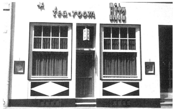
Fassade gegen Steinenvorstadt | Façade vers le Steinenvorstadt | Elevation facing Steinenvorstadt