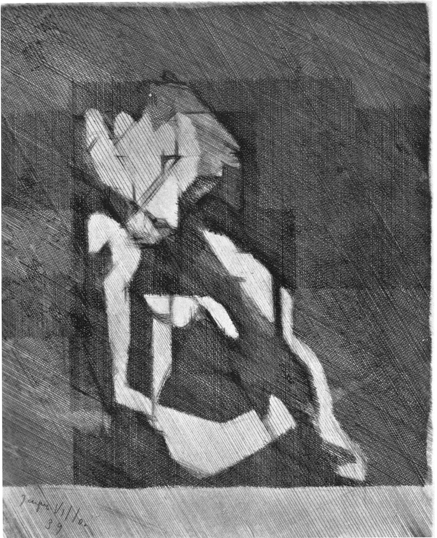
Jacques Villon, Die Anstrengung . Radierung, 1939. 1. Preis | L'effort . Eau-forte | Strain . Etching