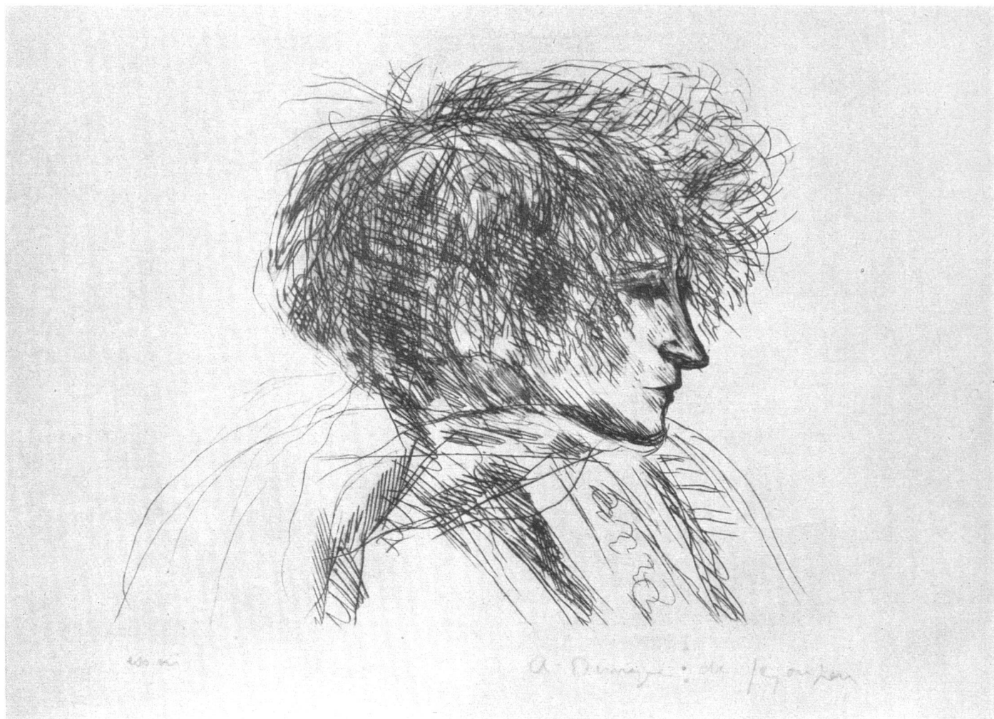
André Dunoyer de Segonzac, Bildnis von Colette. Radierung | Portrait de Colette. Eau-forte | Portrait of Colette. Etching