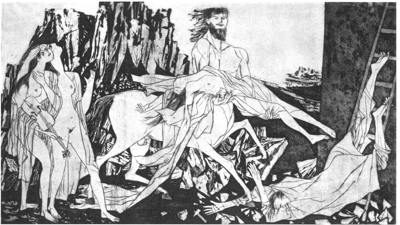
Sigurd Winge, Raserei . Radierung / Fureur . Eau-forte / Rage . Etching