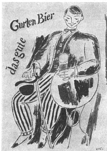
Entwurf: Kurth Wirth, Bern.

haben, um zwischen Bestellerfirmen und Graphikern einen engeren Kontakt zu finden, haben sich nun auch die Berner Graphiker zu einem ähnlichen Versuch entschlossen. Sie haben vor einiger Zeit 13 Berner Firmen eingeladen, sich auf eine neue Art ein Plakat entwerfen zu lassen. Anstatt wie üblich einen Graphiker mit einem Entwurf zu betrauen, übergaben sie diesmal den Auftrag gesamthaft der Ortsgruppe Bern des Verbandes Schweizer Graphiker. Das Problem wurde anlässlich einer Sitzung gemeinsam besprochen, wobei anschließend das Los entschied, welcher Künstler für welche Firma einen Entwurf – gegen bescheidene Bezahlung – herstellen sollte.