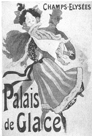
Aus der Plakatausstellung im Kunstmuseum Luzern. Jules Chéret