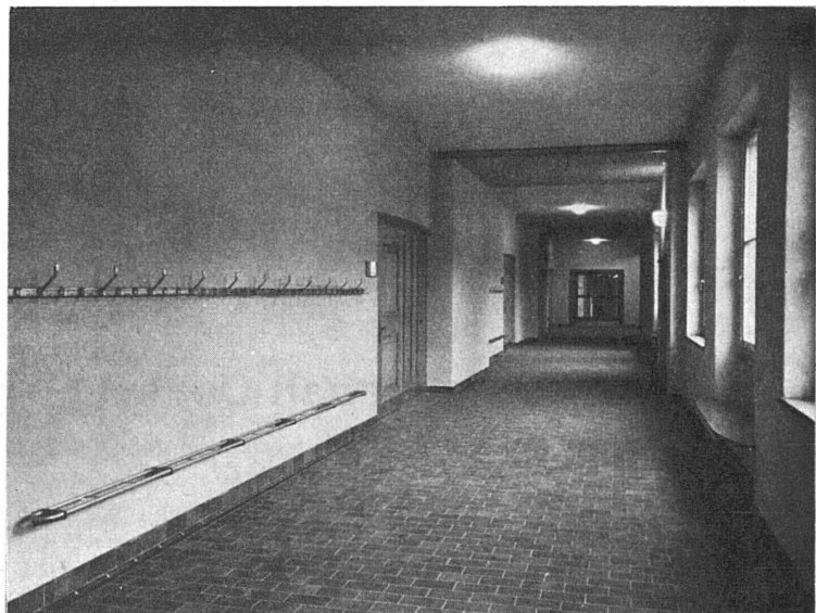
Schulhaus Adliswil 1949

Schulhaus «Im Gut», Zürich Schulhaus Trembley, Genf Schulhaus an der Buchserstraße in Bern Schulhaus Neuenegg/Bern Sekundarschulhaus Konolfingen Schulhäuser Massagno und Molino Nuovo, Lugano, usw.