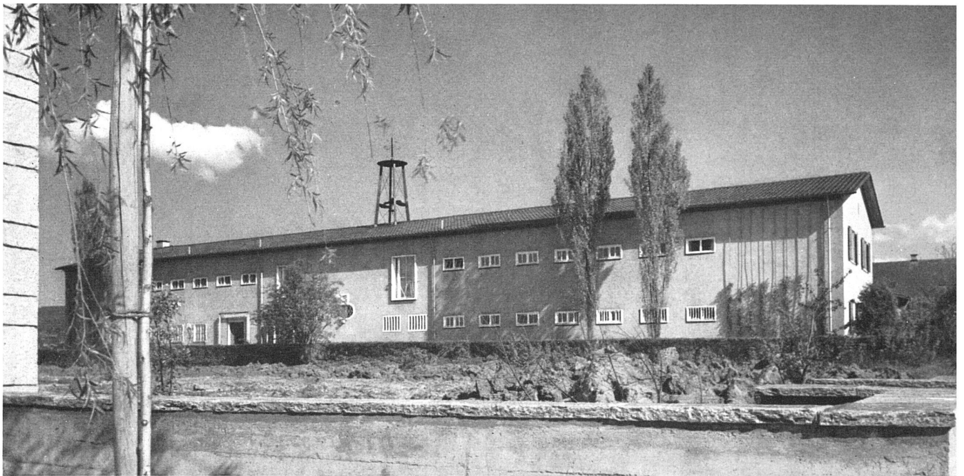
Gesamtansicht von Norden | Façade nord | North elevation