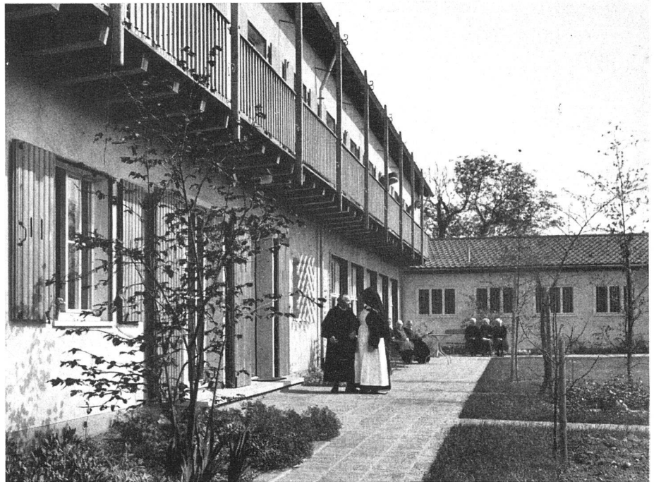
Gartenfront des Altersheims | Façade sud donnant sur le jardin | South elevation and garden courtyard

Situation 1:2000. Unten die vom gleichen Architekten 1949 erstellte St.-Elisabethen-Kirche. Heim und Kirche und spätere Anbauten bilden ein Ganzes | Plan de situation. En bas: l'église St. Elisabeth, construite en 1949 par le même architecte | Site plan. Below: the St. Elisabeth church built in 1949 by the same architect