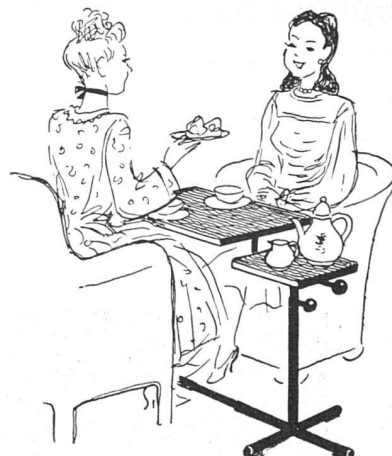
Und hier die liebe Brigitte beim Caruelletisch, mit Tee-Visite