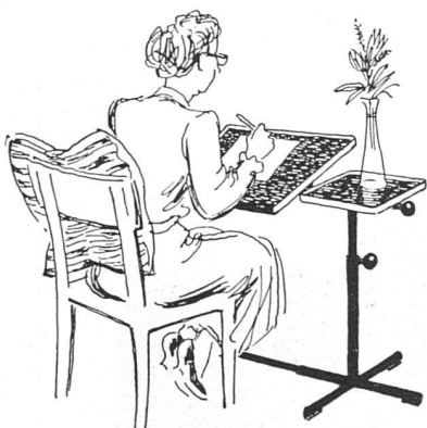
Hier wirkt am Caruelletisch Frau Benz. Ihr Steckenpferd: Korrespondenz