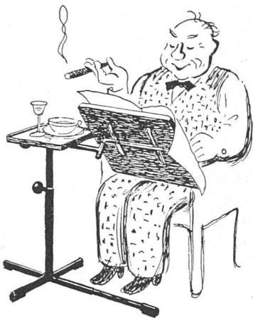
Wir stellen vor: Herr Ufenast samt Caruelle-Tischchen (=Mittagsrast)