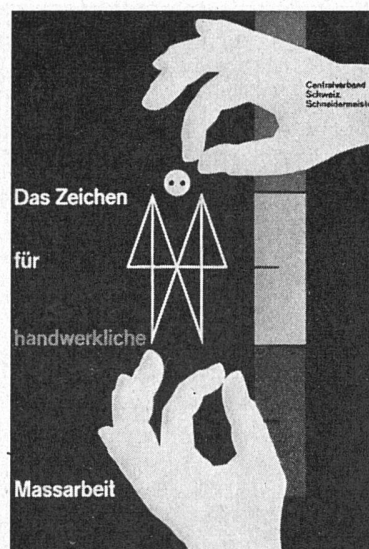
Hans Neuburg SWB, Plakat für den Centralverband Schweiz. Schneidermeister, hervorgegangen aus einem vom SWB unter 5 Graphikern durchgeführten Wettbewerb

Die Fülle des im Buche dargebotenen Materials zeigt, wie breit der Interessenbereich und das Talent Neutras gelagert sind. Die Aufzählung der verschiedenen Abschnitte des Buches, die jeweils mit einem kurzen, nach Angaben des Architekten verfaßten Textes eingeleitet werden, mag in dieser Beziehung genügen: Wohnhäuser – Mietwohnungen – Versuchshäuser, Handels- und Industriebauten – Projekte – Siedlungen. Eine Synthese der architektonischen und städtebaulichen Ziele und des baukünstlerischen Könnens des Architekten dürfte in dem neuesten Projekt für die Bebauung eines großen hügeligen und bewaldeten Geländes im Herzen von Los Angeles zustande kommen. Es handelt sich um eine Quartiereinheit für 17 000 Menschen mit verschiedenartigsten Wohntypen, Wohnbauten verschiedenster