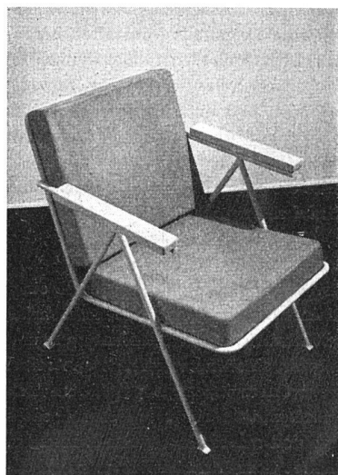
Links: Fauteuil aus Stahl mit Schaumgummipolster. Entwurf: G. Rietveld