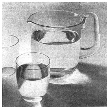
Gläser und Krug aus der holländischen Glasfabrik Leerdam

ren theoretische und praktische Probleme; über Möbel, Geschirr, Textilien; über Ausstellungen im In- und Ausland; man räumt Diskussionen und Kritiken von Lesern breiten Raum ein, und man versucht überhaupt, die Aktivität des Lesers durch kleinere Wettbewerbe anzuspornen.