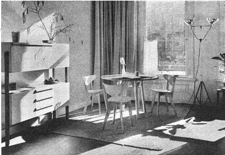
Wohnungseinrichtung nach Entwurf von Wim den Boon, Amsterdam