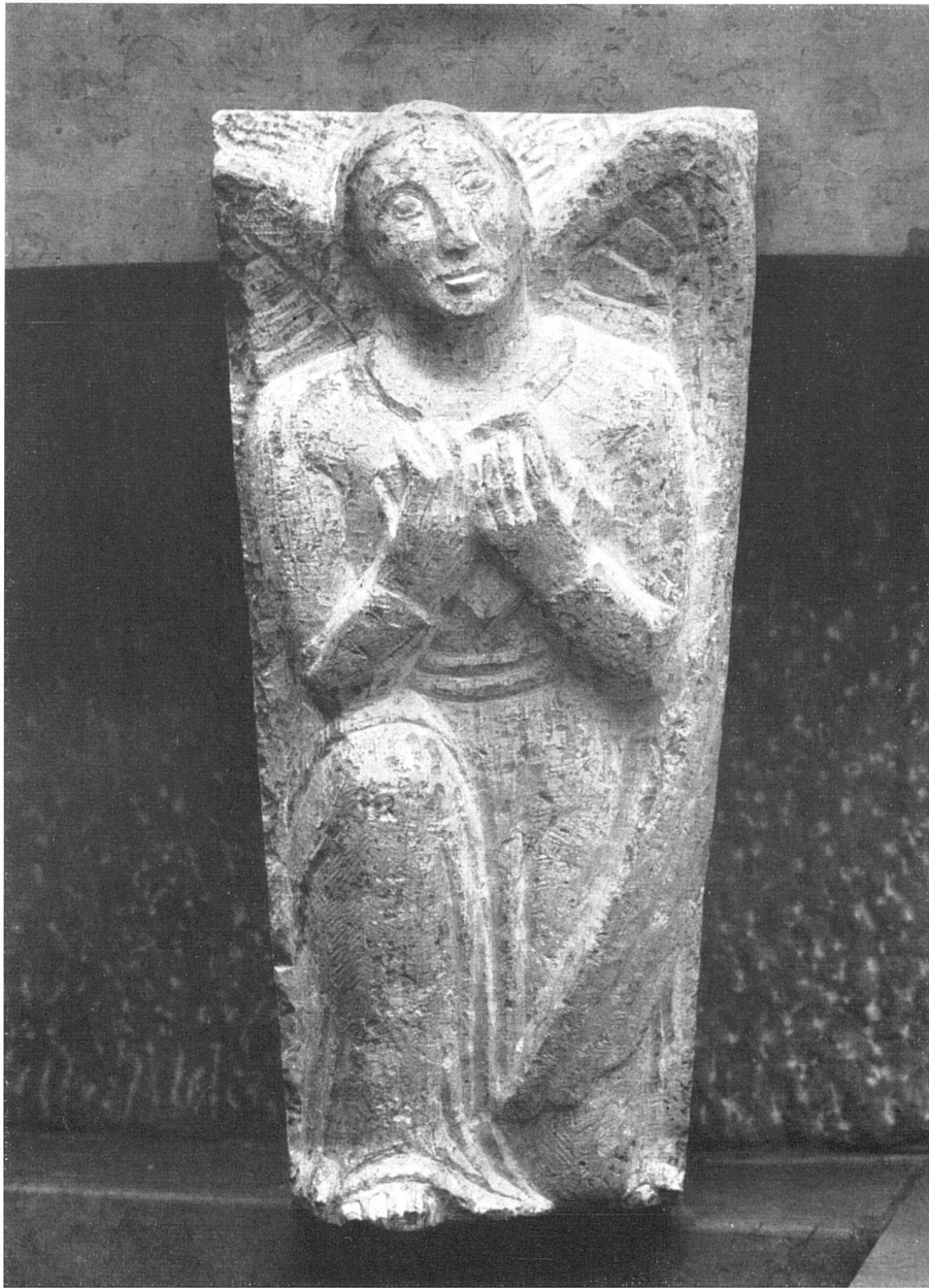
Max Fueter, Engel. Konsolfigur der Kanzel in der Markuskirche, Bern-Wankdorf, Kalkstein | Ange. Figure sculptée de la chaire de l'église St-Marc, Berne-Wankdorf. Pierre calcaire | Angel. Corbel figure in the pulpit of St. Mark's Church, Wankdorf, Berne. Limestone