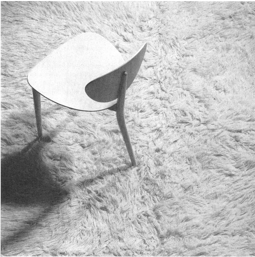
Langhaariger Wollteppich «Velenzes» | Tapis de laine à poils longs | Long-haired wool-carpet