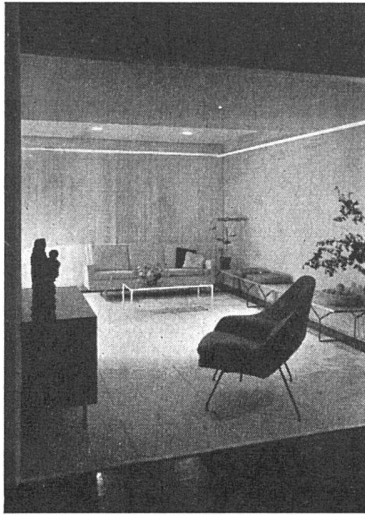
Ausstellungsraum der Knoll International GmbH in Stuttgart.

seits die Notwendigkeit weiterer Ergänzung der Gruppe aus Stuttgart selbst, andererseits, wenn, wie zu hoffen ist, ein strengerer Maßstab angelegt werden soll, für die Zukunft in ein paar Fällen die nochmalige Siebung der Gruppe.