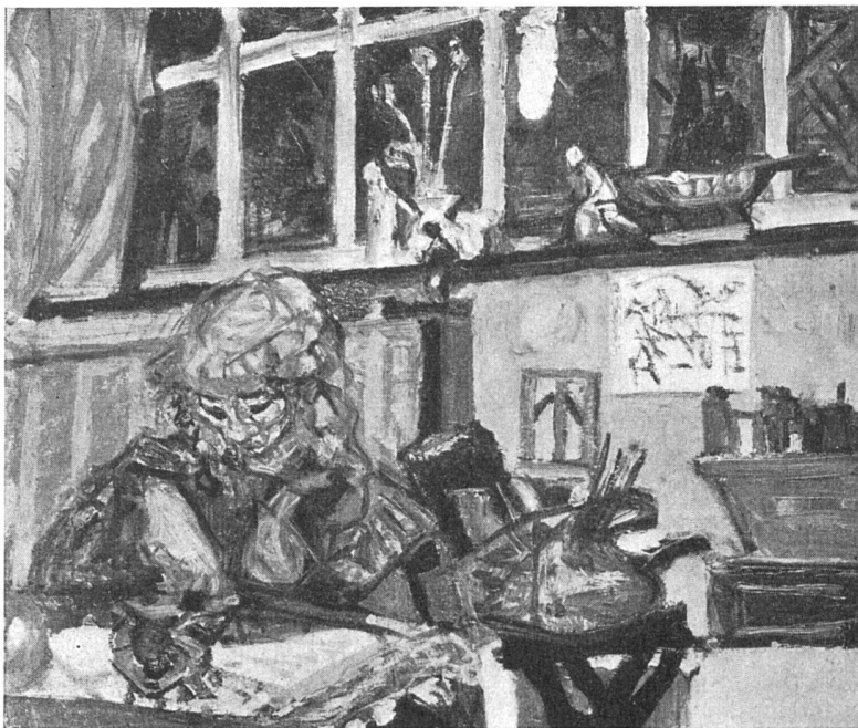
Max Gubler, Interieur bei Nacht , 1952

Das Kunsthaus fährt erfreulicherweise mit der Veranstaltung kleinerer Ausstellungen im Vestibül fort. Im No-