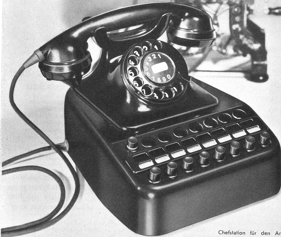
Chefstation für den Anschluss von 8 Amts- oder Hausleitungen

Der sinnreiche Aufbau unserer Telephon-Apparate ist das Ergebnis langjähriger Erfahrung. Albis-Stationen sind formschön, betriebssicher und angenehm zu bedienen.