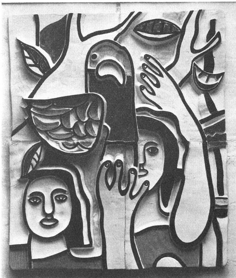
Fernand Léger, Frauen mit Vogel, mehrfarbiges keramisches Relief.

Was Van Eyck, der Nestor der europäischen Porträtmalerei, als Erbe hinterließ, war ein ungeheurer Ernst, eine Sachlichkeit und Einfühlung, die