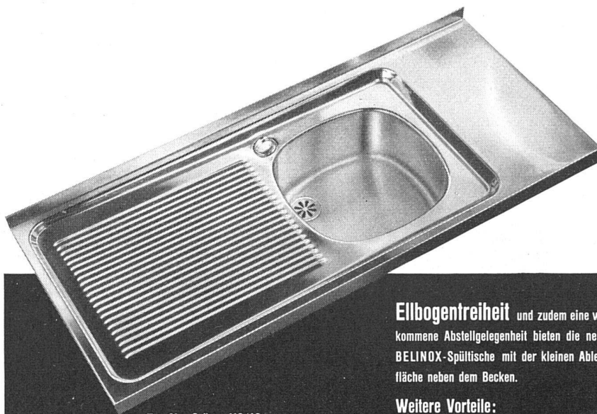
Typ 21 Grösse 110/48 cm

Ellbogentreiheit und zudem eine willkommene Abstellgelegenheit bieten die neuen BELINOX -Spültische mit der kleinen Ablagefläche neben dem Becken.