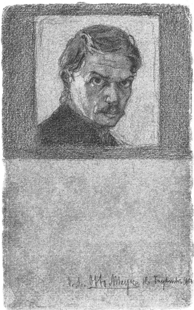
Otto Meyer, Selbstbildnis 1906, Bleistift. Privatbesitz | Autoportrait 1906, mine de plomb | Self-portrait 1906, pencil