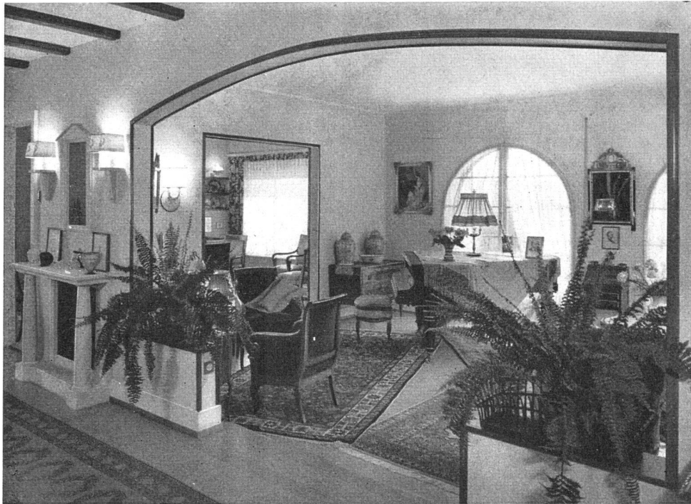
Abbildung zeigt eine Installation mit RAYRAD an Innenwänden und unter Fenstern, unsichtbar

eignen sich vorzüglich für Turnhallen, Schulhäuser, Ladenlokale, Windfänge, Wohnräume, Arbeitsräume, Garagen usw., kombinierbar mit Radiatorenheizung