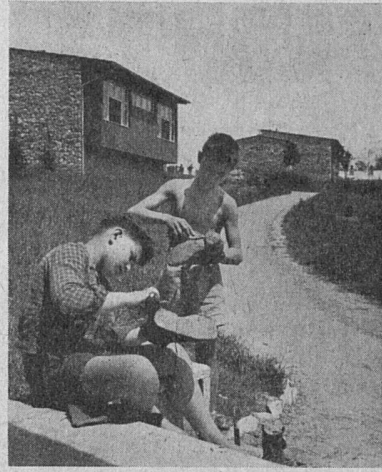
Die «Kleine Stadt» in Granešina bei Zagreb. Architekt: Ivan Vitić, Zagreb