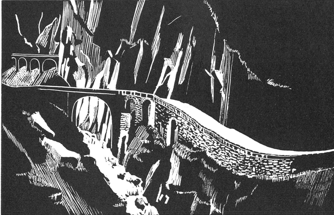
Teufelsbrücke in der Schöllenen

Dank unermüdlicher Forschungsarbeit unserer Laboratorien und weiterer Fortschritte in der Fabrikationstechnik, ist es gelungen, die Lebensdauer unserer Fluoreszenzlampen um ein Vielfaches zu erhöhen, und eine unübertroffene Qualitätsstufe zu erreichen.