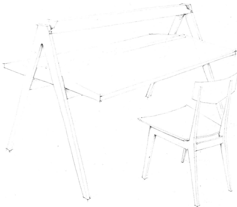
Lesetisch mit Beleuchtung in Blechschirm / Table de lecture / Reading table with light fixture