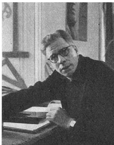
Zum Tode Hugo Paul Herdegs (1909–1953)

Auf einer Reise in den USA erreicht mich die Nachricht vom tragischen Tod Hugo Paul Herdegs. Tragisch, weil er ihn viel zu früh traf und weil sein Lebenswerk nun Fragment bleiben muß. Wie keiner vermochte er das Geheimnis der Nähe zu lüften, wie keiner konnte er den Gegenstand, ob Negerstatuen, prähistorische Reliefs oder die bunte Konservendose für eine Reklame, zu gesteigertem Leben erwecken. Picasso sagte einst: «Les objets n'ont pas de qualité de noblesse.» Herdeg brachte für jedes Objekt die gleiche Intensität der Einfühlung auf, um das Möglichste aus ihm zu pressen, für jeden Architekturauftrag, für jeden Reklameauftrag. Im Grunde aber