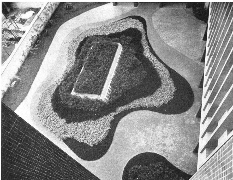
Blumenfeld im Hof des Wohnbaues «Prudencia». Architekt: Rino Levi | Parterre de fleurs dans la cour de l'immeuble Prudencia | Flower bed in the courtyard of the Prudencia apartment block in São Paulo