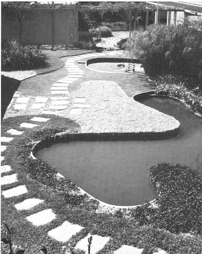
Dachgarten Bau «Reseguros» | Toit-jardin | Roof-garden

Es gibt schließlich den Garten des 19. Jahrhunderts, den Garten für den Spaziergänger, für den Sonntags-spaziergang der Großstadtmasse: F. L. Olmsteds Central Park in New York, 1858, und den reizvollsten von allen, Les Buttes Chaumont, den Alphand um 1860 mitten in ein Pariser Arbeiterquartier legte. Sein Verwenden verschieden hoher Niveaus mit Ausblicken, Panoramen und Ansätzen, aus dem passiven einen akti-