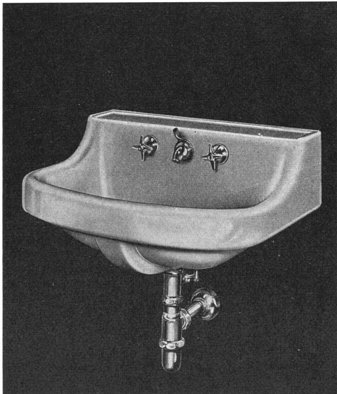
Größe: 63 x 48 cm

in «Standard» Vitreous China, mit Mischbatterie in Rückwand und praktischer Ablaufventilbetätigung. Verdeckter Überlauf vorne unter dem Beckenrand. Rückwand als Tablar ausgebildet zur Aufnahme von Toiletten-Gegenständen. Weiß und farbig lieferbar. Zu beziehen durch die Mitglieder des Schweizerischen Großhandelsverbandes der sanitären Branche.