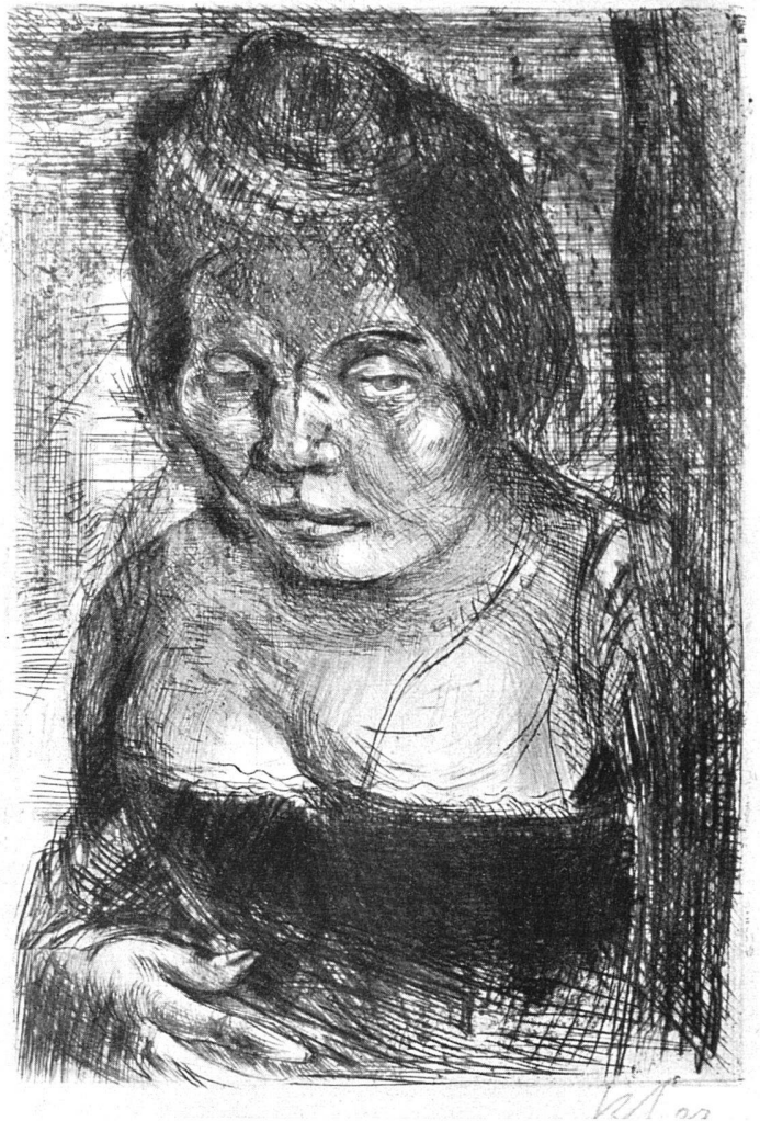
Robert Schürch, Frau mit schwarzem Mieder, 1927. Radierung | Femme au corsage noir. Eau forte. 1927 | Woman with black bodice, 1927. Etching

Schürch kommt auch in den Radierungen in überzeugender Weise zum Ausdruck. Die technische Bewältigung durch Ätzung, Kaltnadel oder eine Mischung der beiden Arbeitsweisen hat Schürch nie ernstliche Schwierigkeiten bereitet. Es ergibt sich dies schon aus der Tatsache, daß ihm mit seiner dritten Radierung, dem «Zirkus» (Clown mit Maske in der Hand), eines seiner sowohl technisch wie formal vollkommensten Blätter gelungen ist. Das Überarbeiten, wie es mit dem Arbeitsvorgang des Radierens oft verbunden ist, lag ja nicht eigentlich in der Linie von Schürchs leidenschaftlich-vehementer Künstlerpersönlichkeit. Was ihm auf den ersten Wurf nicht gelang, das pflegte er meist zu verwerfen, um es dann immer wieder von neuem in Angriff zu nehmen. Darum liebte er die Arbeit mit der kalten Nadel. «Ich habe bemerkt, daß mir das, was ich direkt auf die nackte Platte zeichne, am besten gelingt», schrieb er mir einmal im Zusammenhang mit seinen ersten Radierversuchen. Schürch hat trotzdem rasch erkannt, daß die Druckgraphik eigenen Gesetzen zu folgen hat. Mit sicherem Instinkt sah er Ziel und Begrenzung dieser subtilen Ausdrucksform ein und wußte