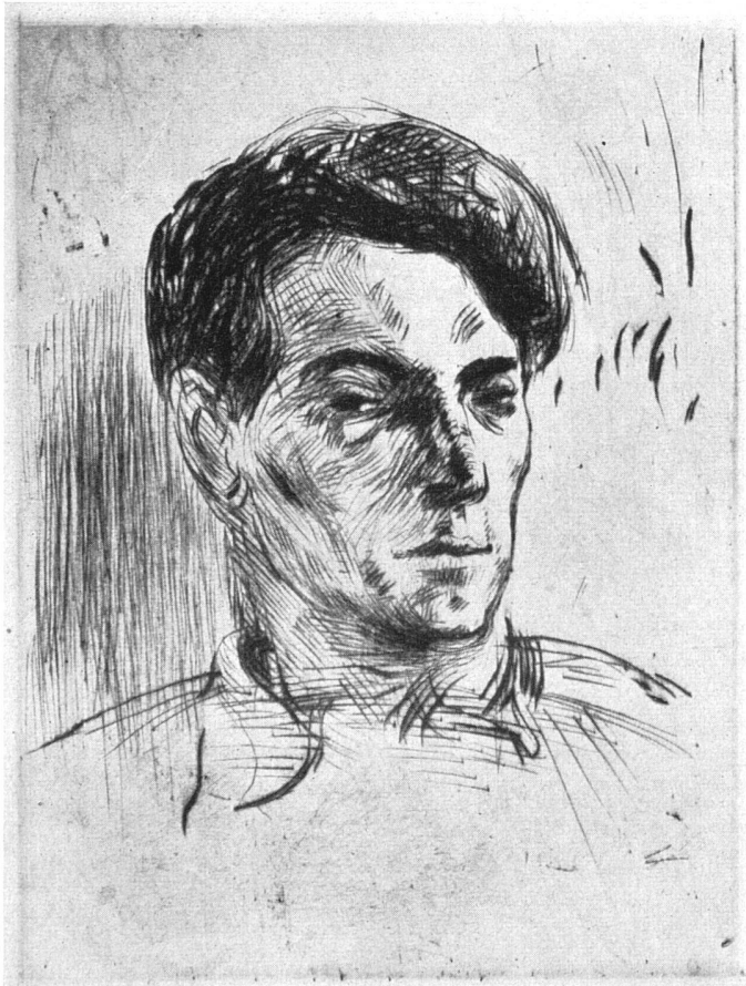
Robert Schürch, Bildnis eines jungen Mannes . Radierung / Portrait d'un jeune homme . Eau forte / Portrait of a young man . Etching