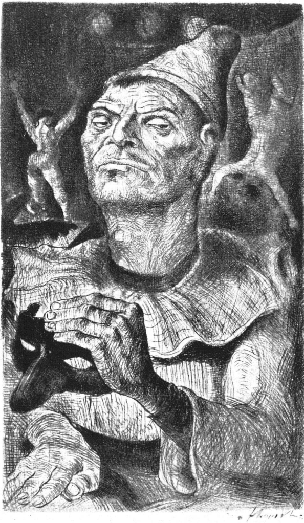
Robert Schürch, Zirkus, 1927, Radierung | Cirque, 1927. Eau forte | Circus, 1927. Etching