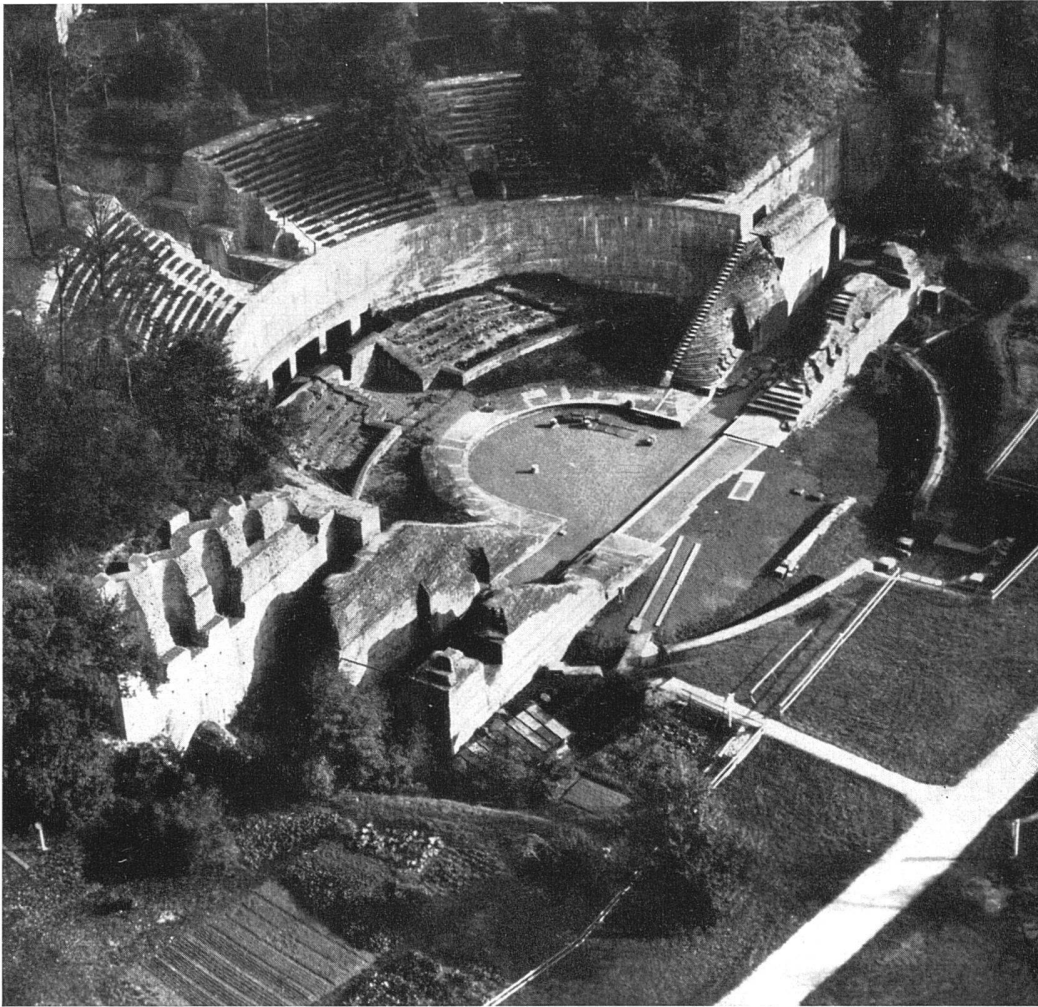
Römisches Theater in Augst, erbaut Ende des 1. Jahrhunderts n. Chr. für 10 000 Zuschauer. Es wird heute noch für gelegentliche Aufführungen benutzt | Théâtre romain à Augst, fin du 1 er siècle après J. C. | Roman theatre at Augst, end of 1st century

Aus der Revue «Schweiz», herausgegeben von der SVZ, Nr. 10, 1952