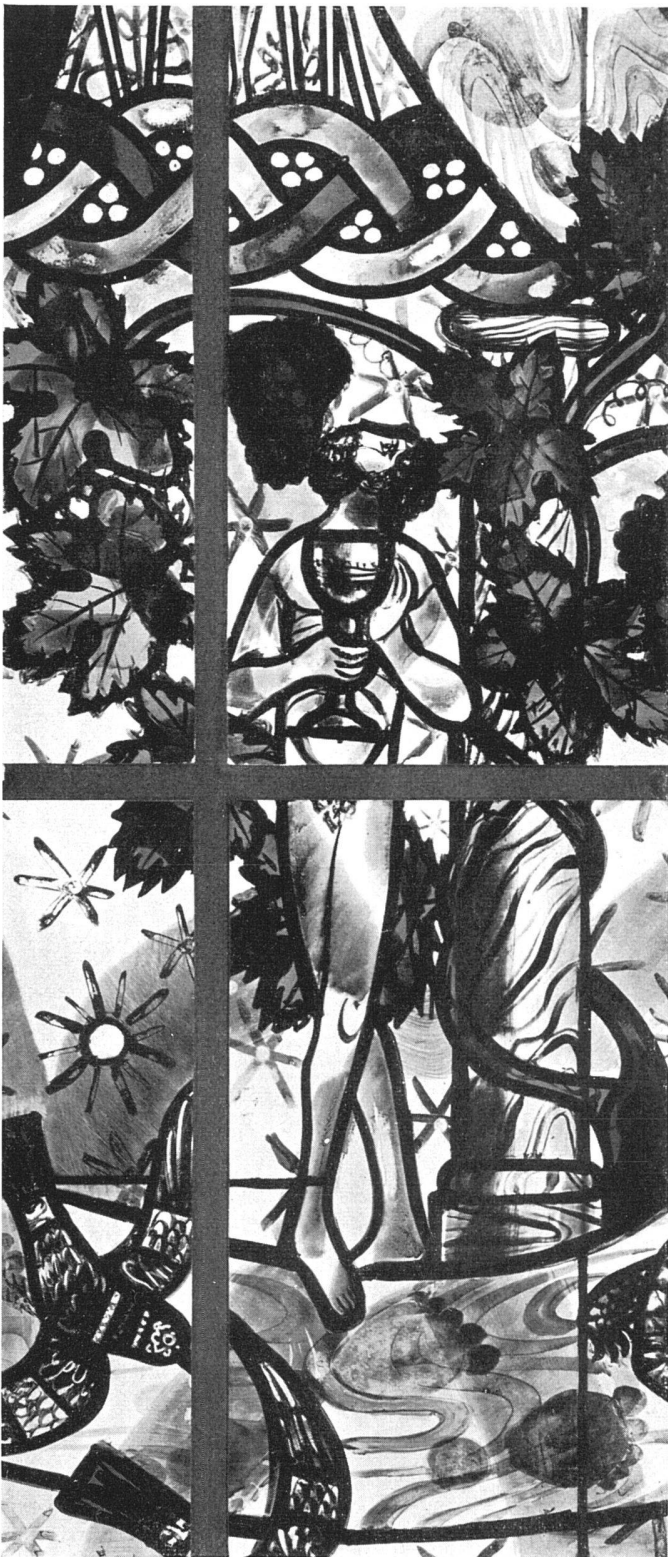
Der Wein. Detail aus dem Glasgemälde II | Le vin. Détail du vitrail II / Wine. Detail of window II 56

che die gewinnende Eigenart seines Chorfensters in der restaurierten Johanneskapelle in Ürikon am Zürichsee und der drei größeren Chorfenster in der alten Kirche Zürich-Wollishofen ausmacht. Die Überzeugungskraft seines Gestaltens liegt nicht zuletzt darin, daß es in der Kleinform der Buchillustration (Grimmelshausens «Simplicissimus» und «Der verlorene Sohn» von André Gide), in der freien Graphik, im Staffeleibild und im großdimensionierten Glasgemälde sich gleichbleibt. Künstlerische Ehrlichkeit in der ungezwungen-familiären Art erzählender oder sinnbildhafter Realistik, liebevoll-erlebnisreiche Sprache der Einzelheiten und unbefangener Formsinn in der Aufreihung und Bindung darstellerischer und ornamental-rhythmisierter Bildteile machen das Unverwechselbare, sich immer wieder aus sich selbst Erneuernde dieser völlig unschematischen Kunst aus.