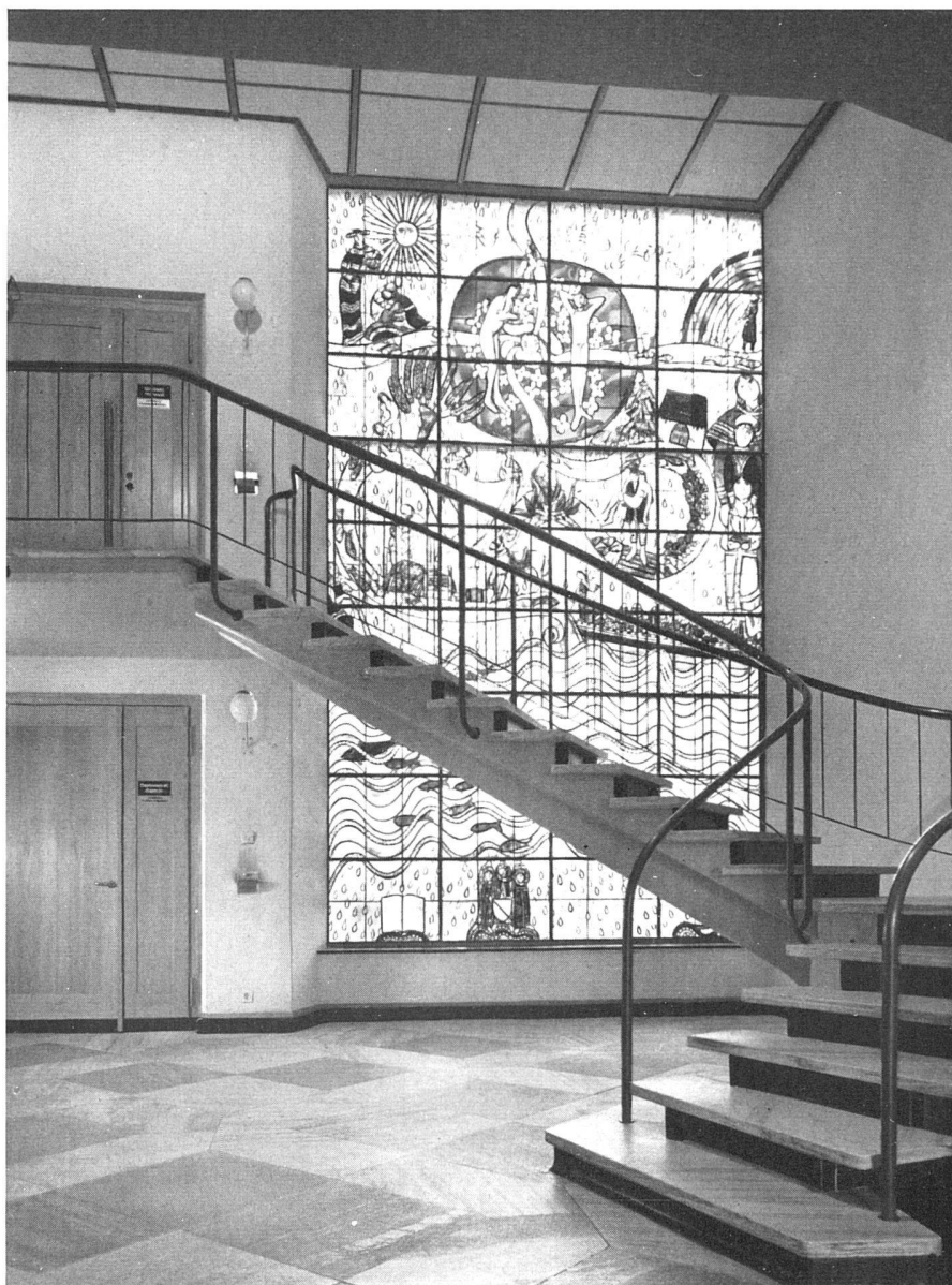
Vorraum des großen Hörsaales mit dem Glasgemälde I «Wasser und Licht – Tag» von Max Hunziker / Vestibule du grand amphithéâtre avec le vitrail I de Max Hunziker, «L'eau et la lumière – le jour» / Main Lecture Room vestibule, with the stained-glass window I – «Water and Light – Day» by Max Hunziker 53