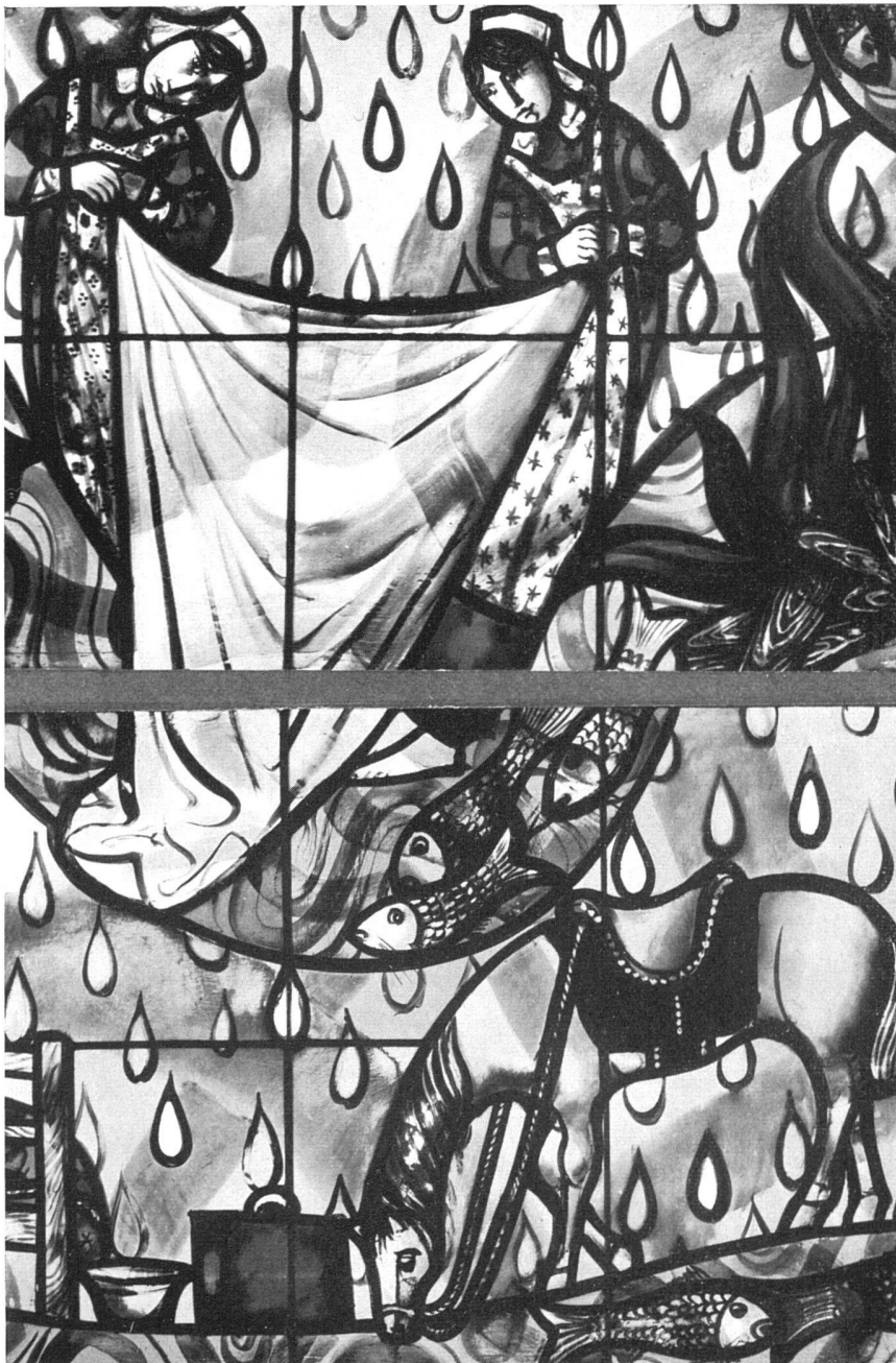
Krankenschwestern. Detail aus dem Glasgemälde I / Infirmières. Détail du vitrail I / Nurses. Detail of window I 55