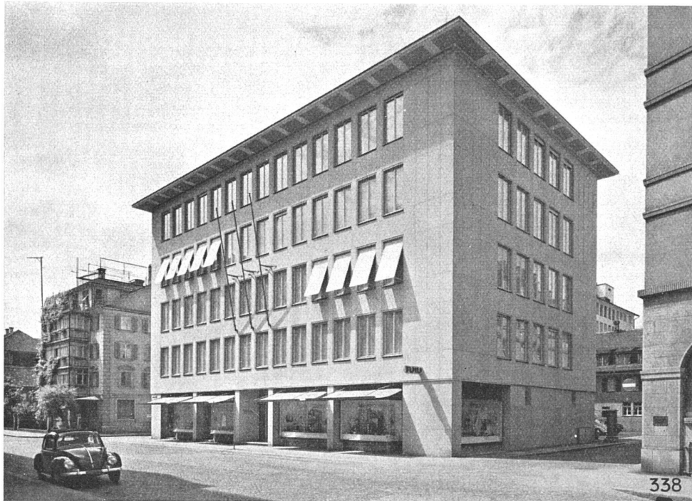
Geschäftshaus Glärnschhof, Zürich, 1951

Fassadenverkleidung in gelblichem, künst- lichem Muschelkalk