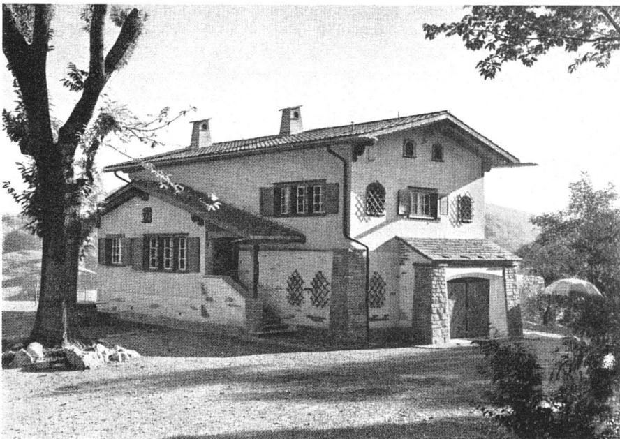
Irgendwo in der Schweiz: Der «Heimatstil» kümmert sich nicht um die örtlichen Gegebenheiten der Ebene und der Bergtäler. Seine protzige Verlogenheit ist eine Beleidigung der Heimat / Quelquepart en Suisse: Le soi-disant «style patriotique», négation totale de l'interprétation saine des données régionales, absence de bon sens et de bon goût / Somewhere in Switzerland: Example of so-called «Style of the Country», complete negation of local conditions, of sound principles and good taste