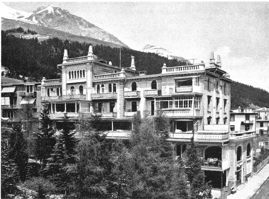
Heilstätte «Du Midi» vor dem Umbau. Die Unruhe und Hohlheit dieser Architektur verletzen die Schönheit und Größe der Berglandschaft / Le sanatorium «Du Midi», Davos, avant la modernisation. Agglomérat de styles offensant la sérénité du paysage / «Du Midi» sanatorium at Davos before remodelling, an offense to the grandeur of the landscape

Quant aux constructions nouvelles édifiées, par exemple, dans de beaux vieux villages, c'est essentiellement une question de talent et de tact. a. r.