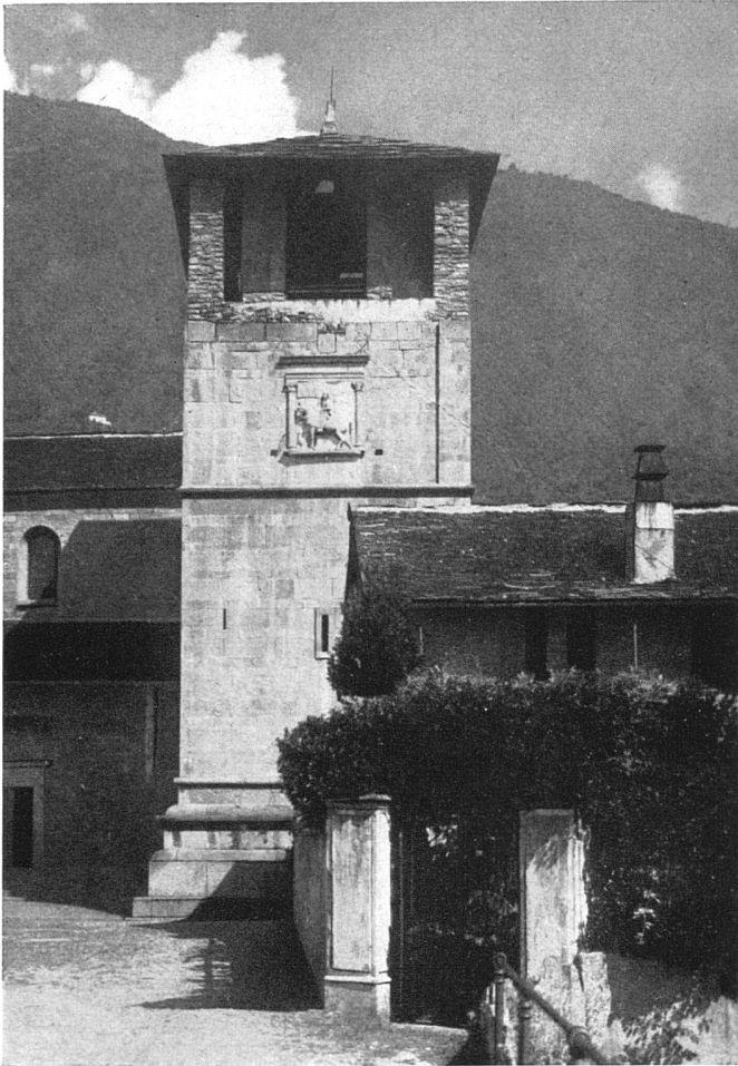
Kollegiatkirche San Vittore in Muralto. Zustand um 1920. Das imposante Fragment des Spätrenaissanceturmes (begonnen 1524) wurde, nachdem der Ausbau wegen einer Hungersnot aufgegeben war, mit einem rustikalen Glockengeschoß abgeschlossen, das die kraftvollen Formen des Unterbaus nur umso stärker hervortreten ließ / Campanile de la collégiale de San Vittore, Muralto-Locarno (commencé en 1524). Vue prise vers 1920 / Tower of the collegiate church of San Vittore in Muralto-Locarno (begun in 1524). Condition in 1920