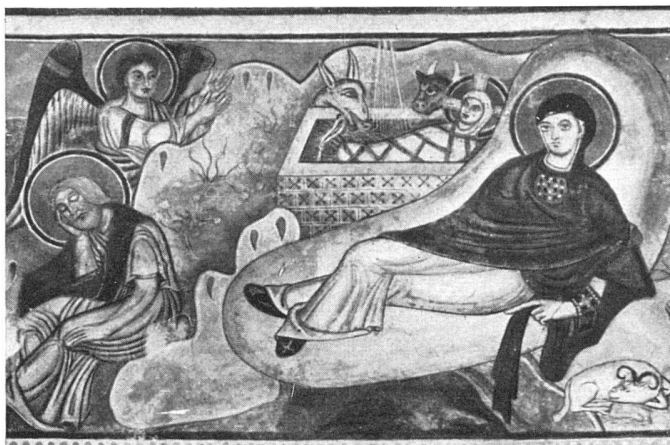
Geburt Christi. Romanisches Wandbild in der Johanneskapelle in Pürgg (Steiermark). Zustand 1939. Die wertvollen Fresken der Zeit um 1200 wurden 1894 mit Ölfarben «restauriert». Sie verloren durch diese barbarische Behandlung nicht nur ihren künstlerischen Wert, sondern erlitten auch schwere technische Schäden | Nativité de Jésus-Christ. Fresque romane de la chapelle Saint-Jean, Pürgg (Styrie), mal restaurée en 1894 | Nativity. Romanesque mural painting in the Chapel of St. John in Prügg (Styria) after being painted over in 1894