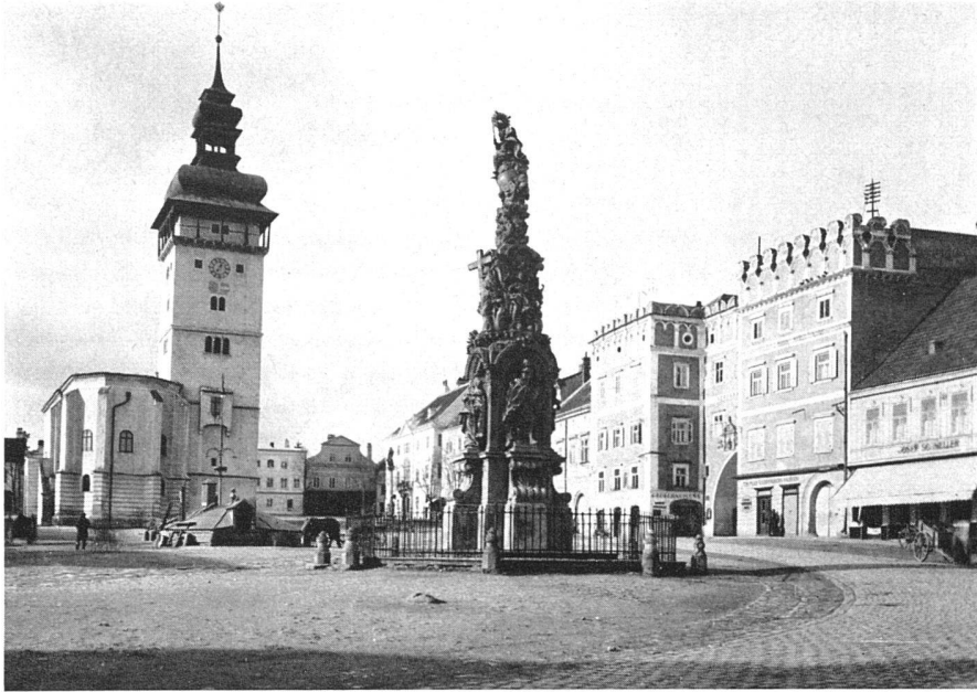
Hauptplatz von Retz (Niederösterreich). Nur drei Objekte dieses Platzes sind Kunstdenkmäler im Sinne des Denkmalschutzgesetzes: Kirche, Dreifaltigkeitssäule und «Verderberhaus» von 1583. Doch sollten um des Gesamtbildes willen auch die übrigen Häuser in ihrem gegenwärtigen Zustande erhalten bleiben. Hier begegnen sich die Arbeitsgebiete der Denkmalpflege und des Heimatschutzes | La grand' place à Retz (Basse-Autriche) | Main square of Retz (Lower Austria)