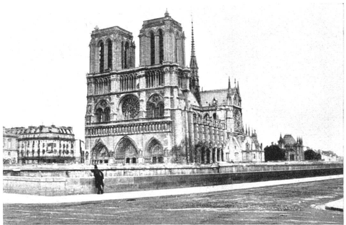
Notre-Dame in Paris nach dem Abbruch des Hôtel-Dieu (Photo um 1872). Die gewaltsame Freilegung entblöbte Notre-Dame – wie viele andere Kathedralen – des lebendigen Zusammenhanges mit der Stadt. Sie steht nun allein, zwar ein großartiges Kunstdenkmal, aber des Maßstabes beraubt / Notre-Dame de Paris après la démolition de l'ancien Hôtel-Dieu / Notre-Dame in Paris after the demolition of the old Hôtel-Dieu

ist notwendig, weil er den Resonanzboden für Kunst und Wissenschaft bildet; auch auf unseren Gebieten wird er immer eine Bedeutung haben, die keineswegs geschmälert werden soll. Umso wichtiger ist es für die Denkmalpflege, ihn zu entschärfen und ihn in seinen Grenzen zu halten. Zu deutlich läßt sich auch in der Geschichte der Restaurierung verfolgen, welches Unheil durch dilettantisches Vorgehen an Kunstdenkmälern angerichtet worden ist. Es ist hierbei nicht die Rede von den Fehlleistungen, die durch eine, wie wir glauben, falsche geistige Einstellung zum Grundproblem verursacht worden sind: durch den «Purismus» etwa oder durch die «Gestaltende Denkmalpflege». Es ist ebenso wenig die Rede von den Schäden, die durch falsche technische Maßnahmen entstanden sind, weil bessere noch nicht bekannt waren; das heißt, daß man jenen Re-