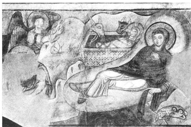
Geburt Christi. Romanisches Wandbild in Pürgg. Zustand 1948. 1948 wurden die Fresken «entrestauriert». Die Zutaten des «Restaurators» von 1894 sind entfernt; man sieht zwar nun die Schäden, die die Malereien im Laufe von 750 Jahren erlitten haben; aber der Rest ist von hoher künstlerischer Qualität und ist wieder zu einem überzeugenden historischen Dokument geworden | La même fresque débarrassée des restaurations (1948) | The mural after the retouchings had been removed (1948)

stauratoren, die um 1890 mittelalterliche Fresken mit Ölfarben restaurierten und sie damit zugrunde richteten, diese auf Grund des damaligen Forschungsstandes gewissenhaft ausgeführten Arbeiten nicht anlasten darf. Hingegen muß es den heutigen Restauratoren, den ehrenamtlichen und hauptberuflichen Konservatoren – und das kann nicht scharf genug zum Ausdruck gebracht werden – auf das übelste vermerkt werden, wenn sie sich an Restaurierungen wagen, ohne sich vorher über die neuesten Forschungsergebnisse informiert zu haben. Die Vervollkommnung der Restauriermittel und -methoden wirft täglich neue Probleme auf. Erst nach gründlicher Prüfung darf der Denkmalpfleger seine Zustimmung zur Anwendung neuer Methoden geben, denn nichts ist verderblicher, als ein Kunstwerk