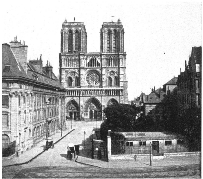
Notre-Dame und altes Hôtel-Dieu in Paris (Photo um 1858) / Notre-Dame et l'ancien Hôtel-Dieu de Paris / Notre-Dame and old Hôtel-Dieu in Paris

Von höchster Bedeutung ist, daß sich der Denkmalpfleger dem Denkmal gegenüber, nachdem er es als solches qualifiziert hat, wissenschaftlich verhält. Es wird ihm dabei freilich immer wieder unterlaufen, daß ihm die Wissenschaft im Stich läßt. Gerade bei jenen Details, die oft für eine Restaurierung von ausschlaggebender Wichtigkeit sind, verläßt sich die Kunstwissenschaft auf den Denkmalpfleger als den in der Praxis stehenden Kunsthistoriker. Er kommt mit den Monumenten stets unmittelbar in Berührung und ist daher in erster Linie dazu berufen, an ihnen abzulesen, was sie etwa über Baugewohnheiten, über technische Verfahren, über stilistische oder ikonographische Einzelheiten und über die geistigen Zusammenhänge unter denen sie begonnen wurden und gewachsen sind, aussagen können. Der Denkmalpfleger muß also, um die Aufgaben, welche die Wissenschaften ihm stellen, erfüllen zu können, ein Fachmann sein, und zwar ein erfahrener Fachmann, der sich zu helfen weiß und selbständig wissenschaftlich zu arbeiten versteht. In der Literatur wimmelt es von den Fehlern, die durch laienhafte Interpretationen dessen entstehen, was an den Monumenten sichtbar ist. Dilettantismus – das Wort hat leider seinen ursprünglich positiven Klang verloren –