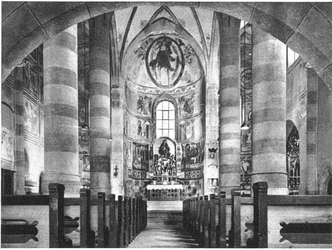
Klosterkirche St. Johann in Münster-Müstair (Graubünden). Inneres mit den drei Apsiden | Eglise conventuelle Saint-Jean, Münster-Müstair (Grisons). L'intérieur et les trois absides | Monastic church of St-John in Münster-Müstair (Grisons). Interior with the three apses