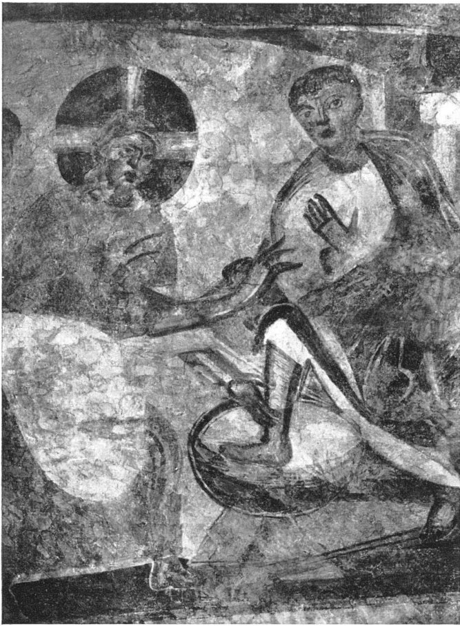
Fußwaschung. Karolingische Wandmalerei an der Südwand. Helle Austupfungen deutlich erkennbar | Le lavement des pieds. Fresque carolingienne de la paroi sud | The washing of the feet. Carolingian mural painting on the south wall

wurden. Von spätgotischen Wandmalereien der Nordwand, die wir opfern mußten, ist eine Katharina an der gleichen Wand, jedoch weiter unten, wieder angesetzt worden. Auf den Kappen der spätgotischen Gewölbe kamen heraldische Malereien zum Vorschein.