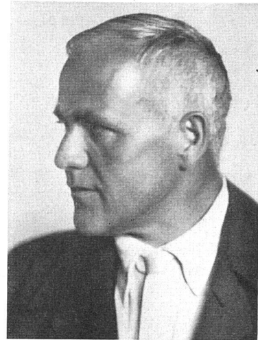
Architekt Hannes Meyer †